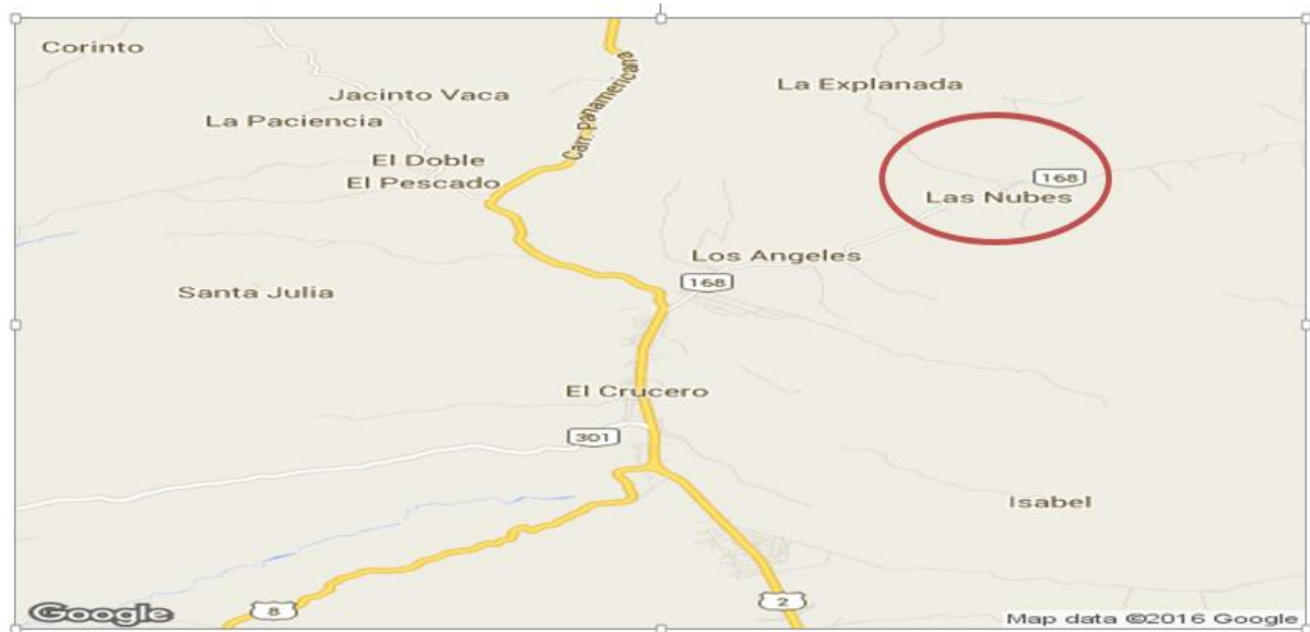
Figura 3. Principales zonas cafetaleras del municipio de El Crucero