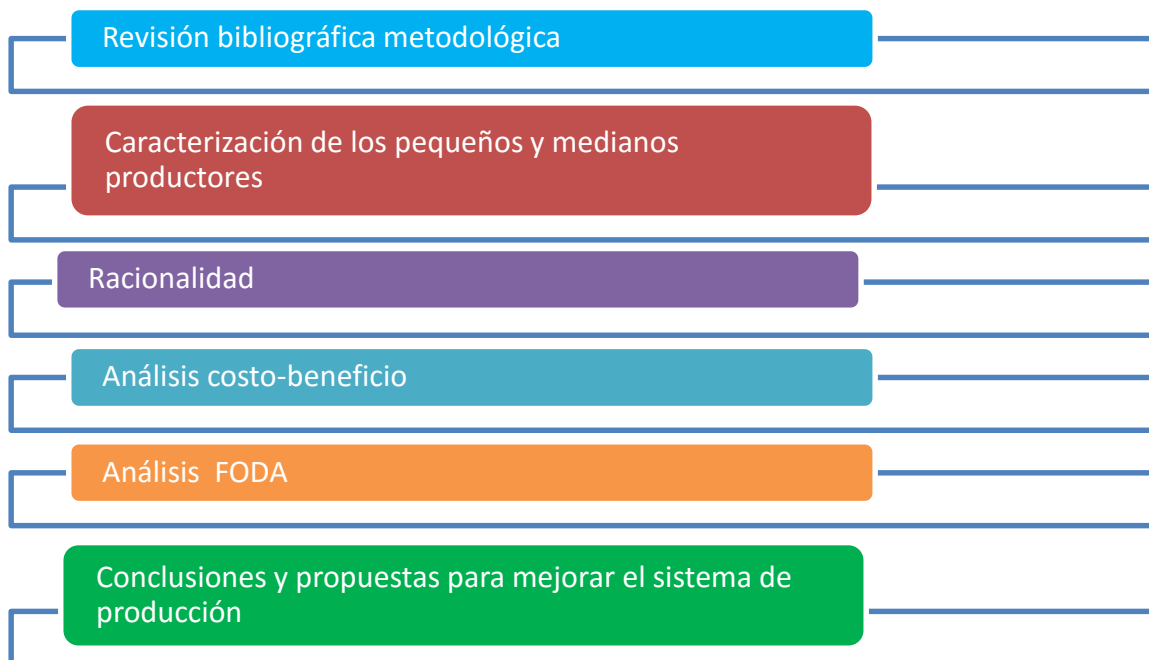
Figura 2 Esquema metodológico para realizar diagnóstico socio-económico de los pequeños y medianos productores de café