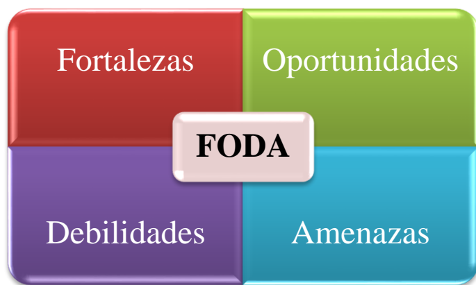
Figura 1 FODA

Se realizará un análisis FODA por medio de esta herramienta metodológica se identificará elementos positivos y negativos del entorno, oportunidades y amenazas, así como las fortalezas y debilidades que enfrentan los pequeños y medianos productores de café de dicha comunidad. Las 4 áreas representan uno fortalezas, aprovechar las oportunidades, reducir las debilidades y luchar contra las amenazas.