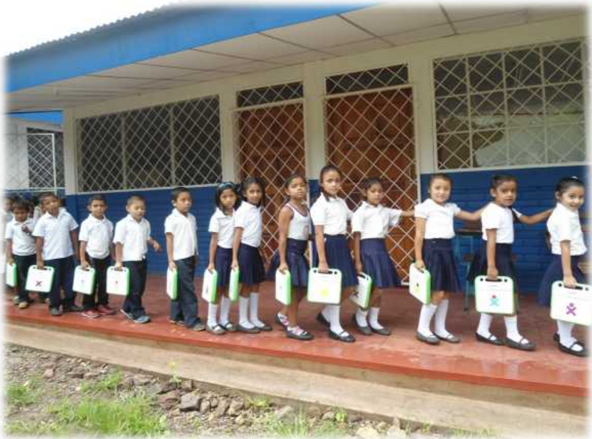
Estudiantes de primer grado de la escuela Rubén Darío Abisinia, retirando equipos XO para el desarrollo de una clase digital.