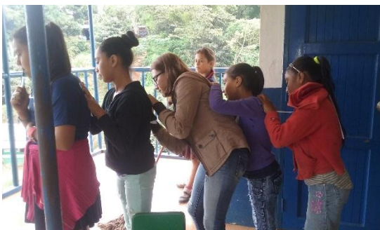
Fotografía 8 Adolescentes durante la actividad, " Me Escribo todo lo que Conozco".