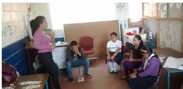
Fotografía 2 Construyendo conceptos de Auto cuidado.