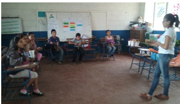
Fotografía 4 Espacio de Reflexión. Espacio de Compartir por medio de conceptos y significados.