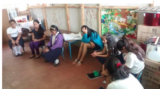
Fotografía 10 Etapa en la Dinamica de Relajación.

En esta dinámica las y los adolescentes fueron ubicados en círculo con sus ojos cerrados de manera que dispusieron a relajarse, respiraron de la mejor manera es decir inhalando de forma que el aire estuviera inflando el estómago hacia afuera y cuando salga metiendo el estómago hacia dentro, esto permitió que el oxígeno entrara y saliera de la mejor manera. Esta dinámica tenía como objetivo la relajación absoluta del cuerpo y de la mente, nos resultó muy bien porque cuando se les oriento abrir sus ojos pudieron expresar de cómo se sentían y todo lo que habían experimentado mediante la dinámica.