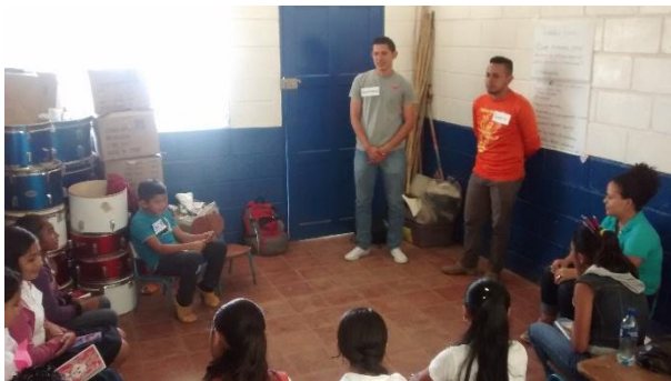
Fotografía 5 Acompañamiento de Vida Joven. Realizando Vivencias y Actividades con grupo Juvenil.

El intercambio de vivencias en las y los adolescentes constituye un elemento fundamental para el proceso de sensibilización, este es un componente que facilita en gran medida todo el proceso de investigación, ya que en un grupo de personas hay mucho que trabajar, se tiene diferentes caracteres,