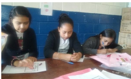
Fotografía 3 Evaluación del Día. Las y los adolescentes realizando la evaluación del taller.

muchas veces ayuda a facilitar su permanencia y expansión, el auto cuidado según plantea Ander-Egg (2013) “Consiste inicialmente en el autoestima que posee cada individuo, formando así barreras que ayudan a proteger nuestro cuerpo, mente y alma, recordando que auto cuidado abarca esto y mucho más”. Es decir que principalmente consiste en cómo se sienten las personas en sus habilidades psicológicas más importantes que se pueden desarrollar con el fin de tener éxito en la sociedad, tener autoestima significa estar orgulloso de sí mismo y experimentar ese orgullo desde el interior.