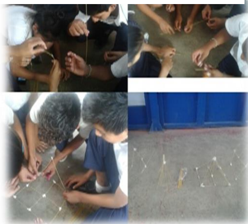
FOTO 5, Actividad la torre de tallarin,28/07/16.

Finalizamos con una asistencia de 40 participantes entre los que se encontraban: 2 facilitadoras, 1 experto y 37 estudiantes.