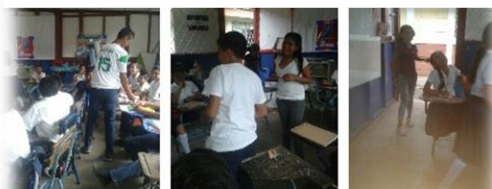
FOTO 16, Intercambio de regalos,06/10/16.

Actividad 2.” El amigo secreto “para este taller nos propusimos cambiar lo acostumbrado y compartir en grupo, repartimos caramelos y paletas a todos los participantes, en el desarrollo de la actividad algunos niños y niñas sintieron pena al momento de abrazar y mencionar un valor que hacia especial a su amigo procedieron a darse un abrazo y cabe mencionar que el valor que más resalto según el grupo es el compañerismo.