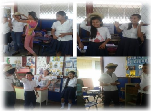
FOTO 22, Evaluación de los talleres,22/11/16.

Actividad 3." Sombrero bailarín", esta actividad estaba propuesta para lograr la evaluación que era uno de los objetivos de la visita. Durante esta actividad se escuchaba la música y