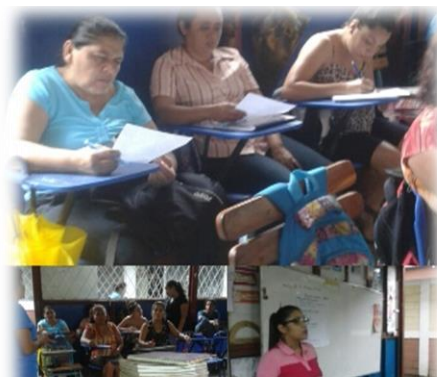
FOTO 19, Actividades con padres de familia, 18/10/16.

Al Final tuvimos la participación de 21 padres, 2 facilitadoras, 1 experto y 1 estudiante.