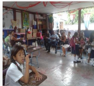
Foto 1. Niños y niñas de sexto grado.05/05/16.