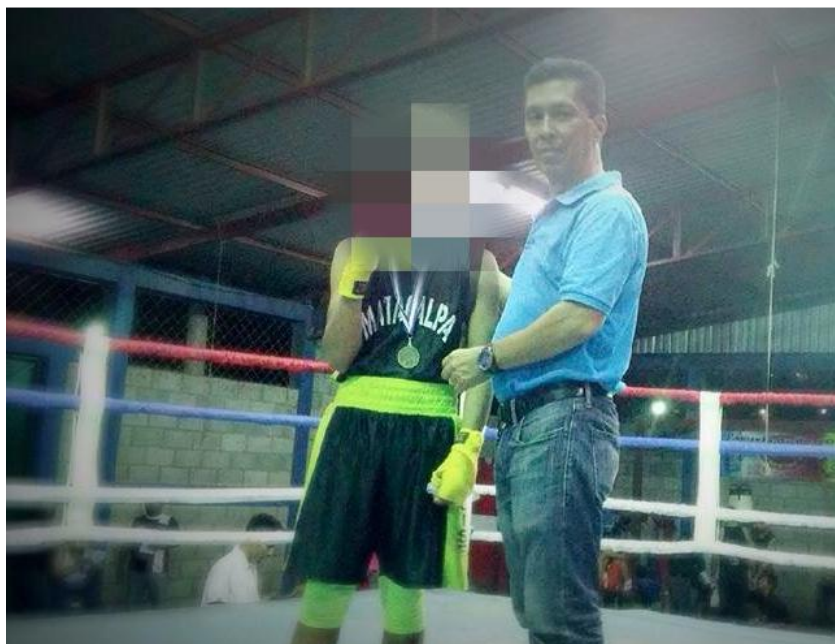
Fotografía N° 6: Entrega de premio primer lugar en boxeo

“Yo practico sólo boxeo, ese deporte es el que me desestresa” (Pérez, 2016), el resto del grupo en su mayoría practican boxeo y han obtenido hasta medallas de las peleas a las que se han enfrentado, este tipo de actividades los motiva y muchos se han encerrado en esto al punto de querer ser