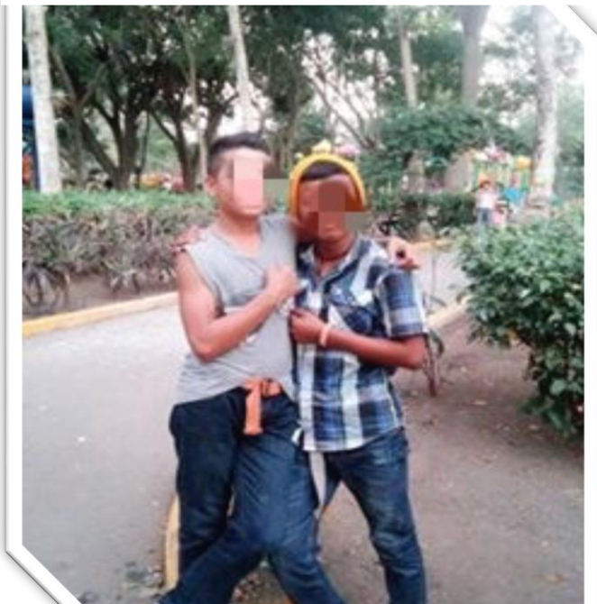
Fotografía N° 1- Adolescentes integrándose al Proyecto

“Se define como el desarrollo humano que marca el final de la niñez y está marcado por cambios biológicos, psicológicos y sociales” (Monroy, 2002), el día que realizamos las visitas al proyecto se pudo observar que en efecto las personas que están en dicho proyecto han tenido estos cambios en cuanto a lo físico son adolescentes que tienen entre los 13 y 18 años de edad, como todos son varones han cambiado la voz, han desarrollado su estatura, el primer día que llegamos algunos estaban muy serios con nosotras, otros apenados pero mientras el tiempo pasaba fueron adquirieron confianza