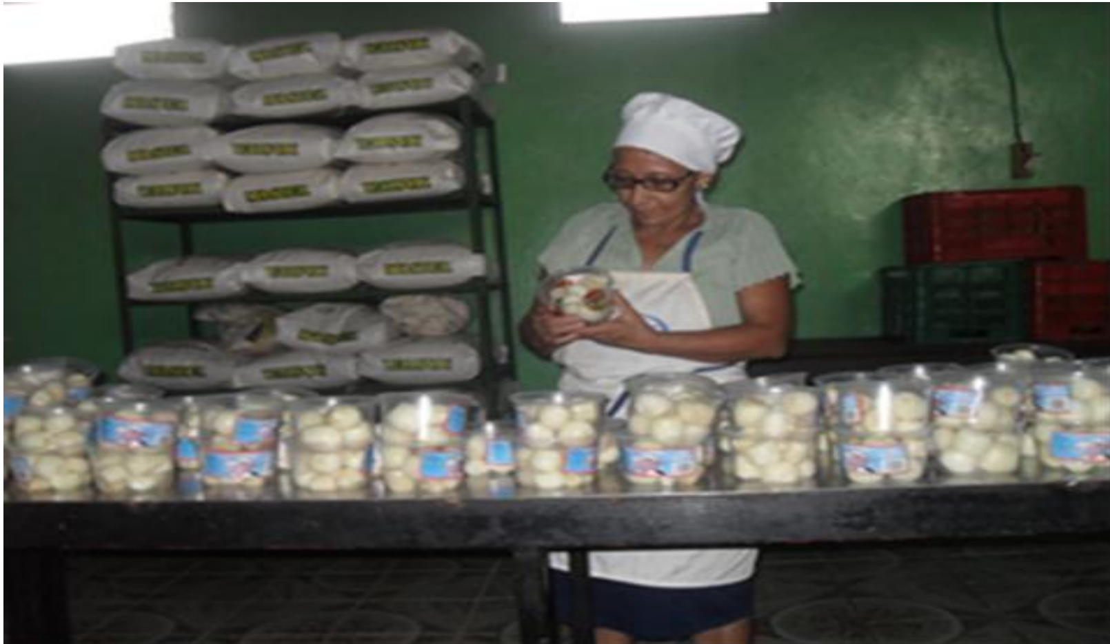
PROCESO DE EMPAQUE DEL PRODUCTO.