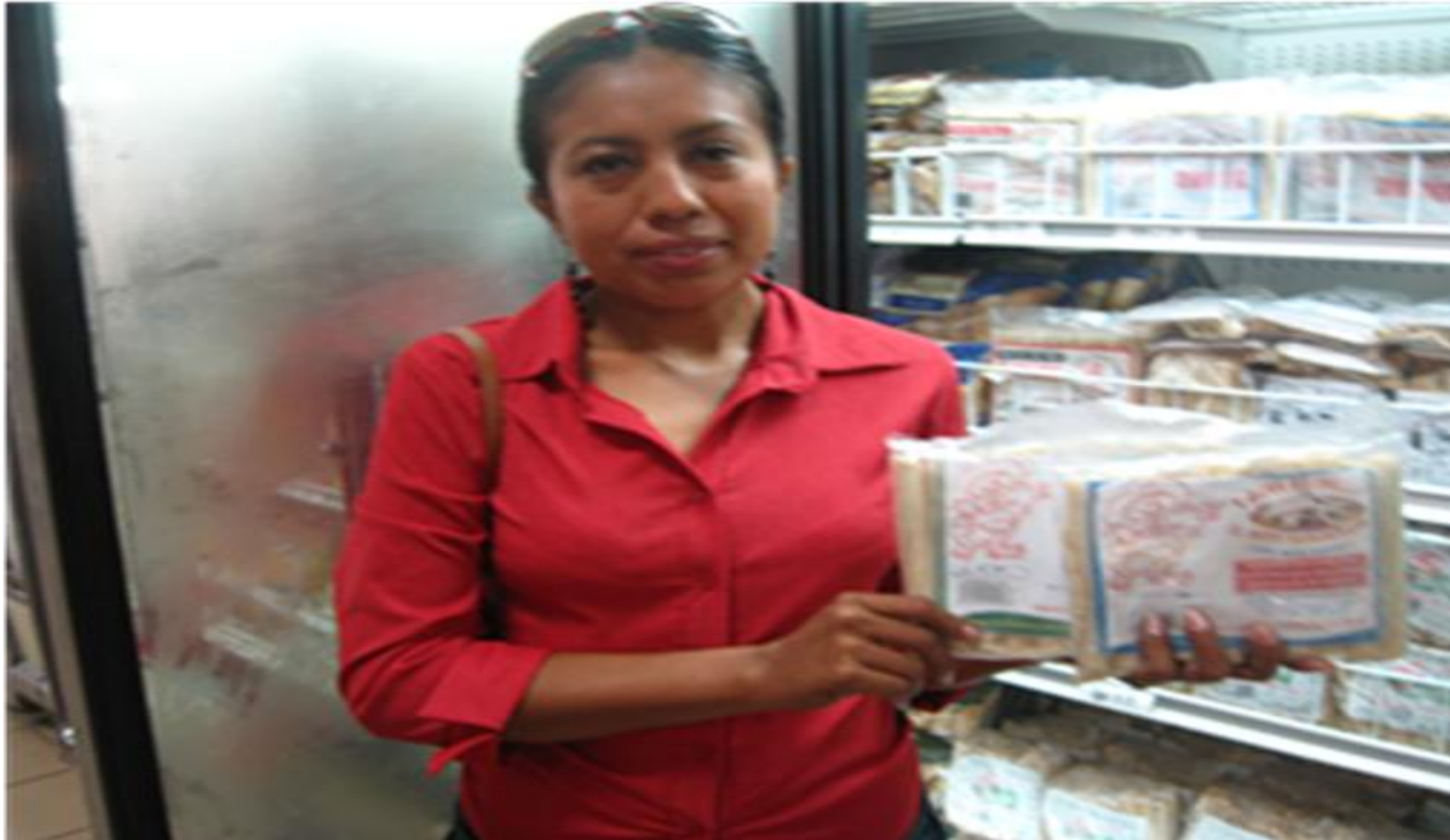
PROPIETARIA EXHIBIENDO SU PRODUCTO EN EL SUPERMERCADO