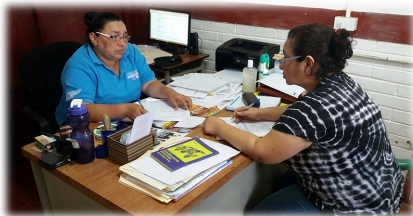
Entrevista Jefa de Área Técnica en su oficina