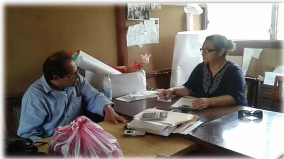
Entrevista realizada al docente, en la sala de maestros

Contando con el consentimiento de cada uno de los informantes claves de este estudio, se hizo uso de una cámara de video y una grabadora para el desarrollo de las entrevistas y el grupo focal, con el fin de registrar de manera completa y fiel toda la información proporcionada.