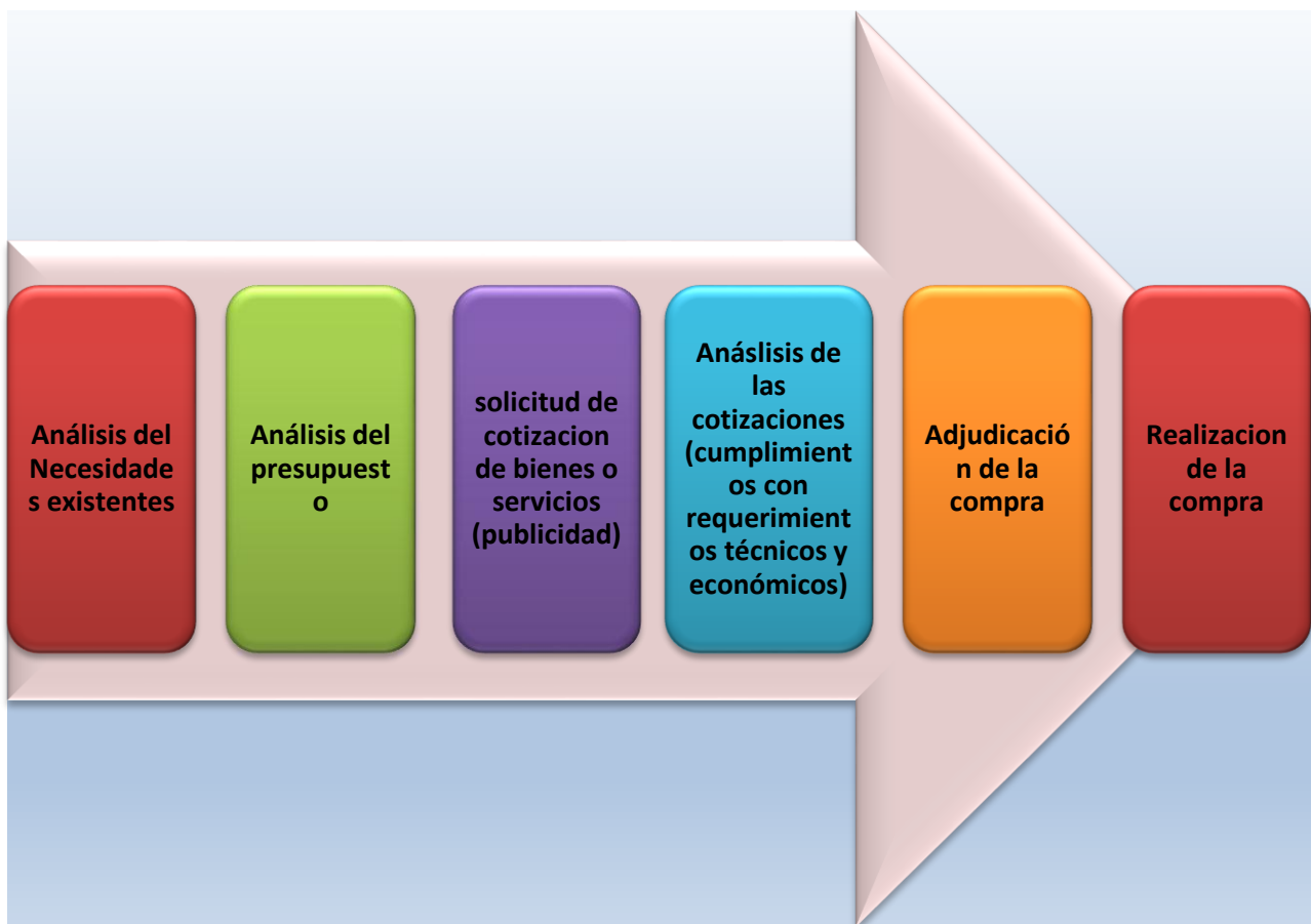
Gráfico N°1: Proceso de compras desarrollado en el Centro María Auxiliadora.

Fuente: Información proporcionada a partir de entrevista aplicada a Directora Centro María Auxiliadora. / Grafica n° 1