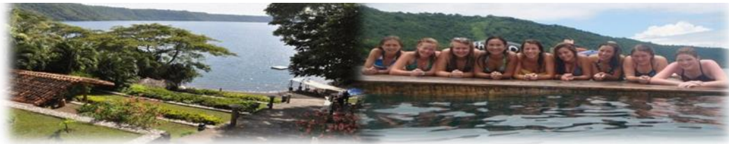
Imagen No.9 Hospedaje The Monkey Hut tomada de Sitio Web Nov.2014

Este local deriva su nombre de los monos aulladores que habitan la zona, brinda un ambiente de relajación con vistas panorámicas a esta laguna como se muestra en Imagen No.9.