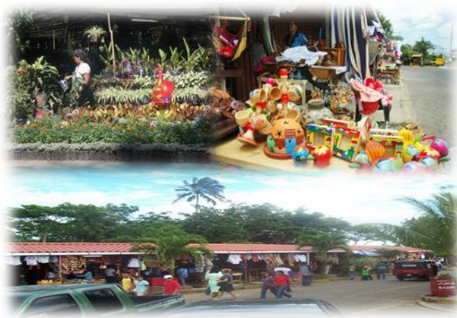
Imagen No.3 Se muestra Comercios en el propio mirador de Catarina tomada por autores en Nov/2014

En la tabla No.2 es posible la apreciación de las cantidades de comercios inscritos según alcaldía municipal de Catarina, de las cuotas en los cuales los Restaurantes la pagan mensualmente, los vendedores ambulantes diariamente, las comiderías y Pizzerías solo pagan matricula más el pago de basura que es mensual estas cuotas 27 son establecidas en proporción a lo que se dedican los comercios en el caso de los puestos de venta de palomitas la cuota mensual es un poco más elevada por lo que ellos ocupan energía eléctrica en estas cuotas ya va incluido el cobro de basura por el mantenimiento de limpieza del mirador de Catarina ilustrado en imagen No.3.