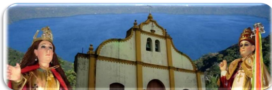
Imagen No 17 Ilustración de Santos patrono del municipio de Catarina e iglesia

A continuación mostremos en Imagen No.17 Ilustración de los santos patronos del municipio de Catarina: