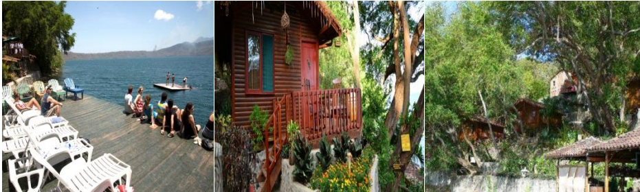
Imagen No.16 hostel posada de LA ABUELA.

A como todos los negocios turísticos alrededor de la laguna de apoyo están debidamente inscritos en la DGI (Dirección General de Ingresos) y realiza el pago de matrícula en la Alcaldía de Catarina. 44