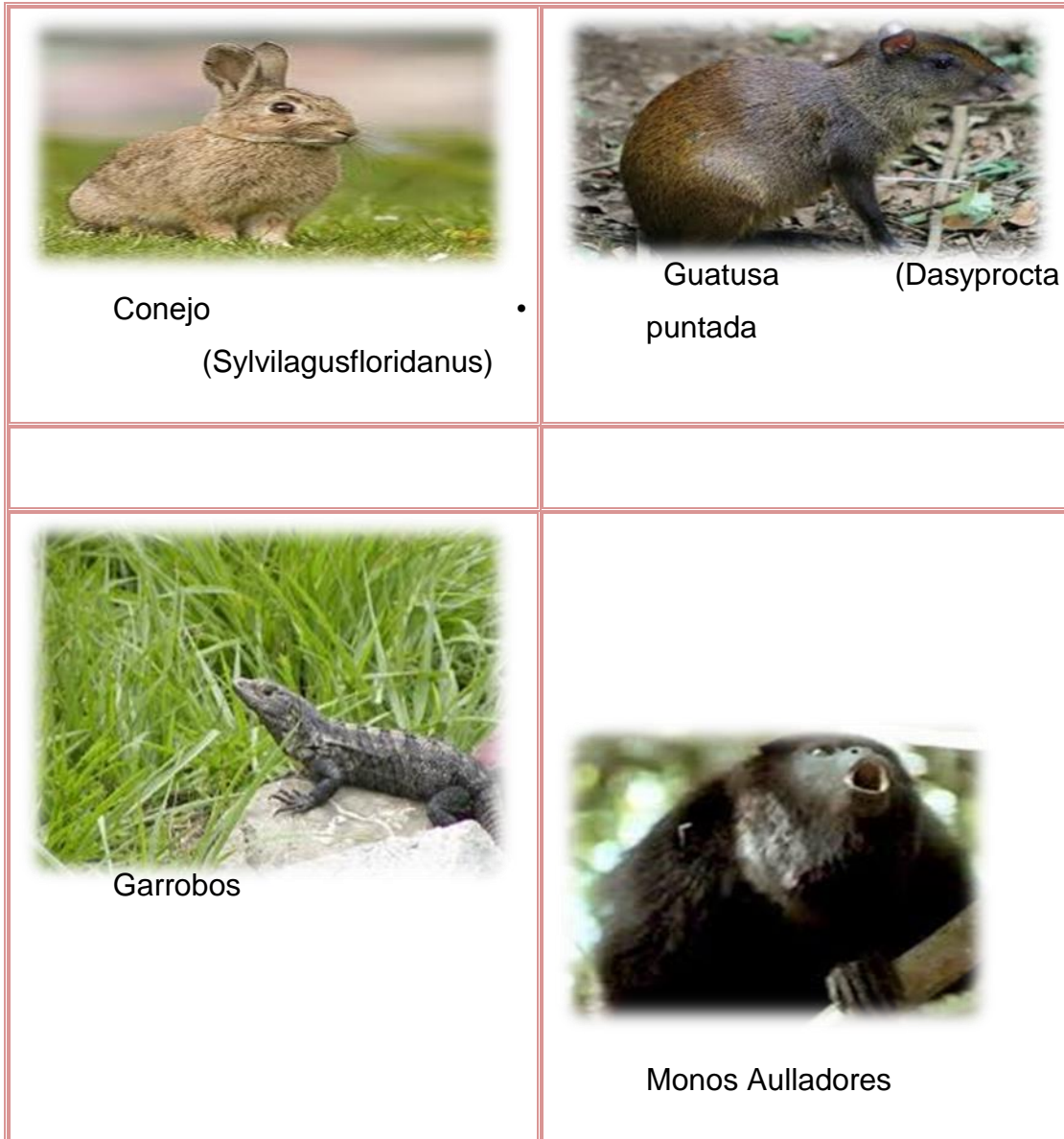
Tabla No.4 Especies de animales del municipio de Catarina en peligro de extinción.