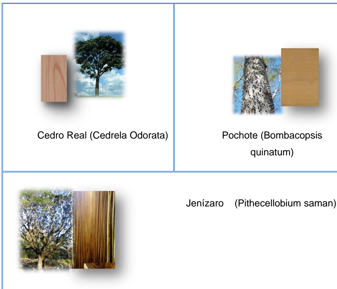
Tabla No.3 Flora en peligro de extinción del municipio de Catarina: