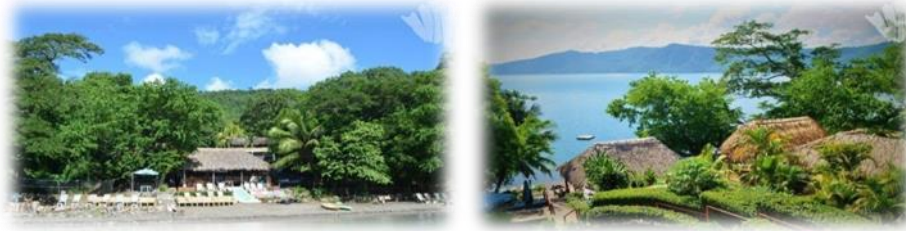
Imagen No.13 Hostal Paradiso tomada de sitio web Nov/2014

Cuenta con un restaurante que también funciona como bar tiene 12 habitaciones, entre las cuales hay cuartos privados y compartidos, equipados con abanico y WiFi gratuito.