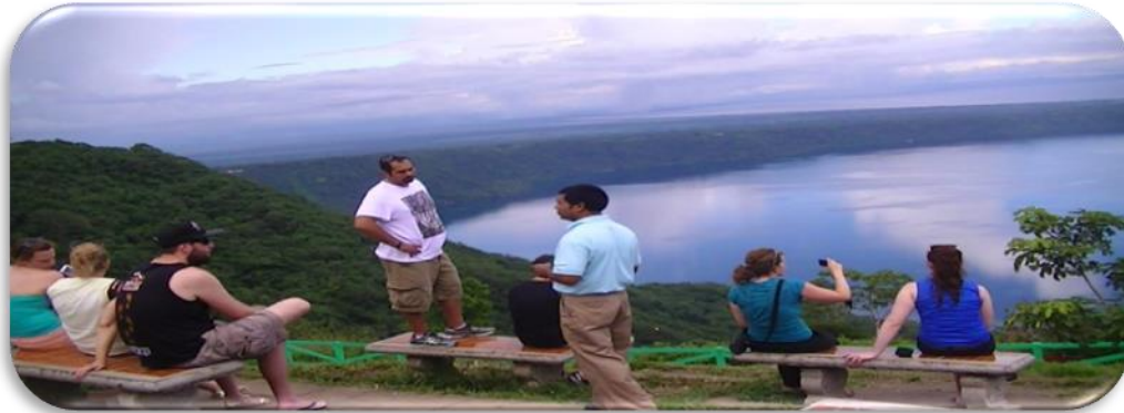
Imagen No4 Afluencia turistas Noviembre 2014

Los ingresos que se perciben en un 70% son destinados para mejoras de dicho centro y el resto se ingresa a la Alcaldía para gastos administrativos y para pequeños proyectos sociales. El mirador tiene una afluencia en 30,000 personas al mes en temporadas normales y con 40,000 personas al mes en temporadas altas las cuales son en semana santa y Diciembre con una división en porcentajes de 60% visitantes Nacionales y 40 % visitantes extranjeros 28 , ilustrados en Imagen No.4 .