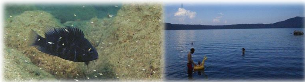
Imagen No.7 Aguas de Laguna de Apoyo sitio web Nov.2014

La Reserva Natural Laguna de Apoyo posee la laguna cráterica más extensa y con las aguas más cristalinas en toda Nicaragua, rodeada por uno de los únicos remanentes de bosque latifoliado en el pacífico de Nicaragua, es una de las mejores y más imponentes vistas escénicas naturales que se pueden conseguir en el país representado en imagen No.7