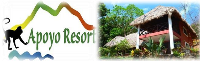
Imagen No.10 Hospedaje Apoyo Resort tomada de Sitio Web Nov.2014

Eco Nature Apoyo Resort & Spa está ubicado justo en el centro de la Reserva Natural Laguna de Apoyo ilustración en imagen No.10.