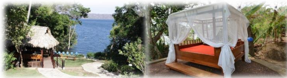
Imagen No.15 Laguna Beach Club tomada de sitio web Nov/2014

Laguna Beach Club en la playa de la Laguna de Apoyo es el punto donde debe empezar una combinación de diversión y descanso. En este local es posible sólo pasar el día por la laguna, pasar también la noche o alimentarse Ilustración en Imagen No.15.