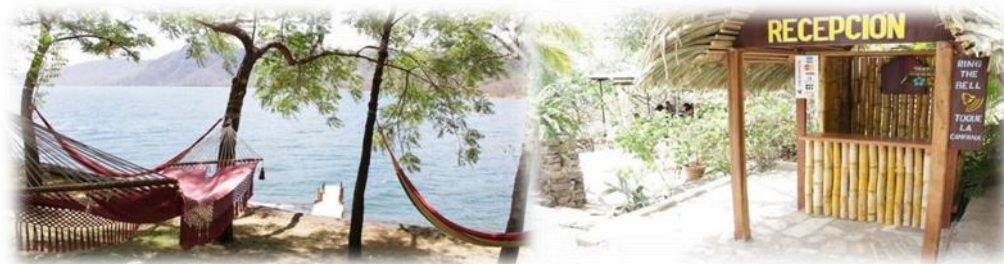
Imagen No.12 Albergue Pájaro Azul tomada del sitio Web Nov/2014

El Albergue Pájaro Azul, ubicado en la costa de la Laguna de Apoyo, abre su amplio local para visitantes que quieran pasar un día u hospedarse y disfrutar de un ambiente natural entre árboles, jardines y animales ilustrados a continuación en Imagen No.12.