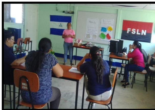
El día 26 de Octubre, en el colegio 12 de Septiembre