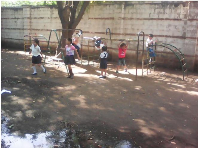
Patio de la escuela, niños de preescolar en receso