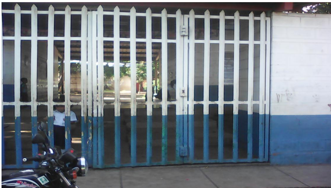
Portón principal de la escuela