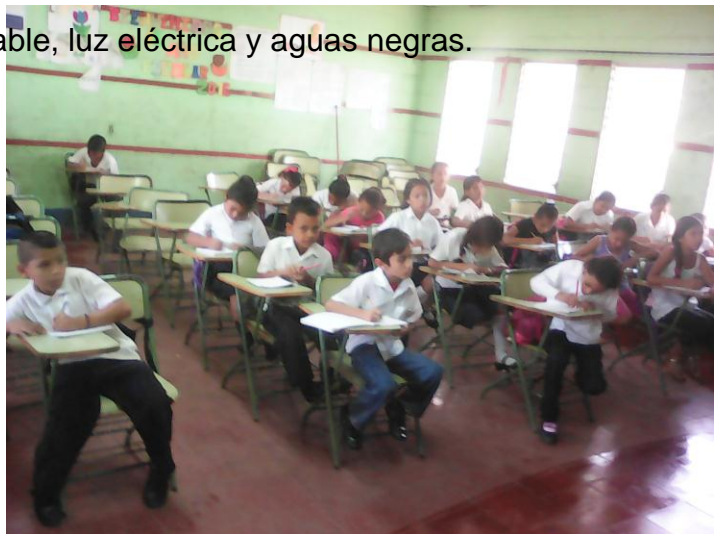
Aula de tercer grado

Las sillas y espacio están acorde a la cantidad de estudiantes del centro, cada aula tiene un inodoro dentro para las necesidades fisiológicas de los niños y niñas, además cuenta con una iluminación natural como artificial, tiene servicios básicos de agua potable, luz eléctrica y aguas negras.