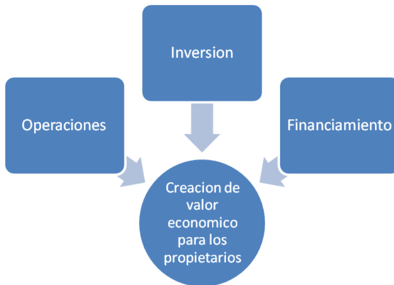
Figura II

Existe una categoría no mencionada anteriormente, que corresponde a la Toma de Decisiones a Nivel de Conocimientos, la cual contempla la evaluación de nuevas ideas para los productos y servicios, las maneras de comunicar nuevos conocimientos y formas para distribuir información en la organización.