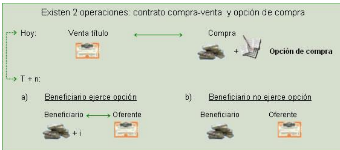
Figura VI

Las opciones transadas en la Bolsa de Valores de Nicaragua tienen la particularidad de ser generalmente opciones de compra y son emitidas simultáneamente, pero independientemente de un contrato de compra-venta de contado. A este tipo de contrato, lo denominaremos a continuación como opcional.