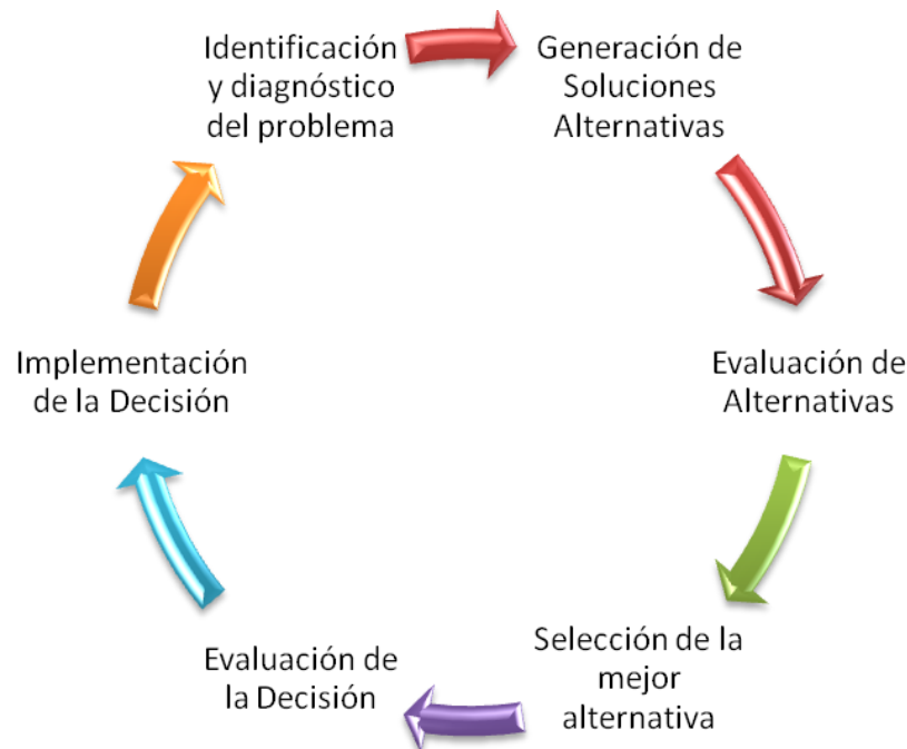
Figura III