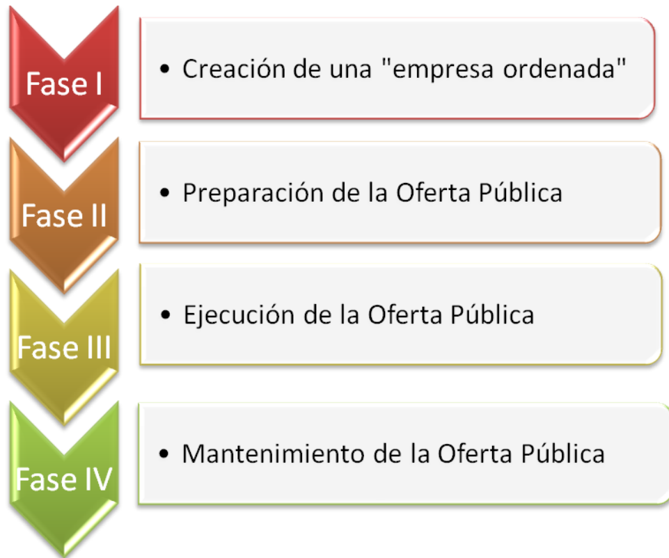
Figura VII.