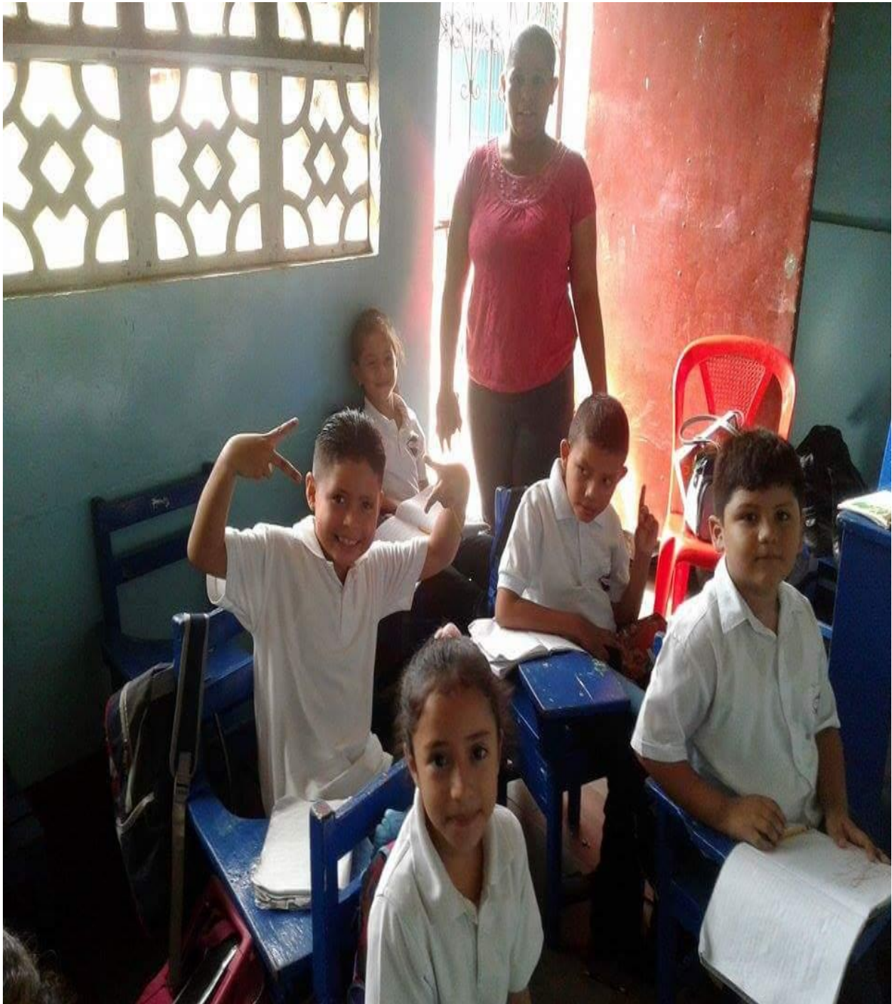
Estudiantes del Primer Grado “A”