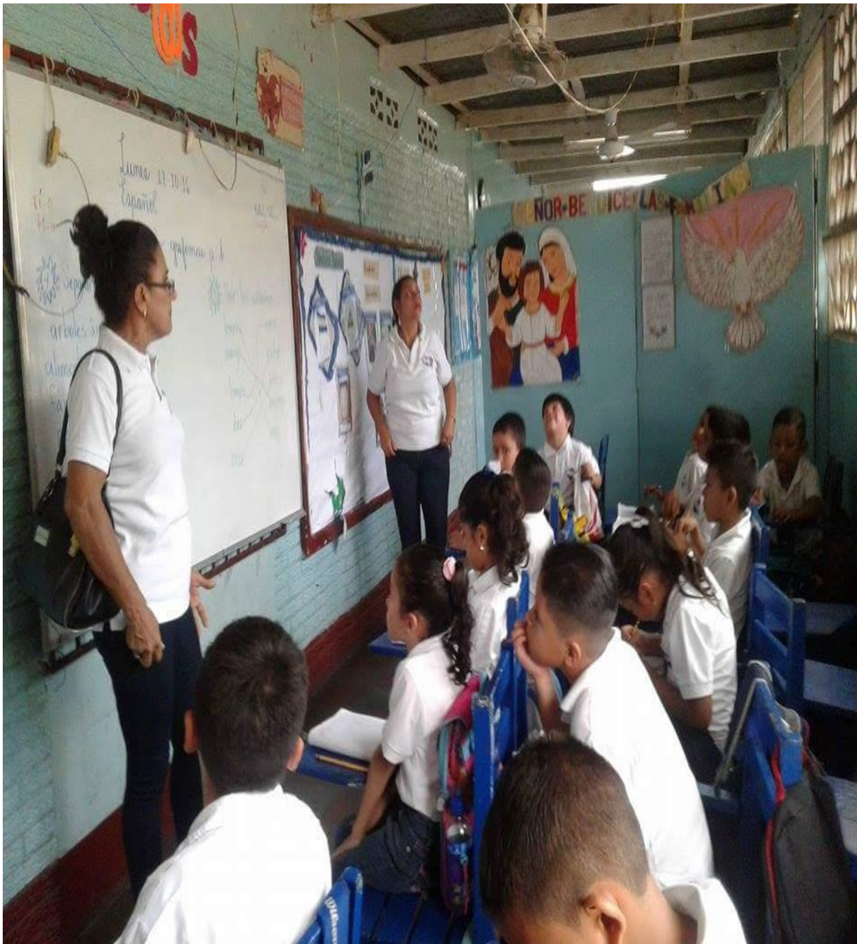
Tercera Observación de la Clase llevada a cabo en el Colegio