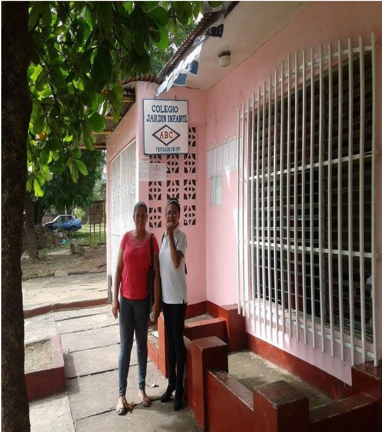
Vista Frontal del Colegio Jardín Infantil ABC