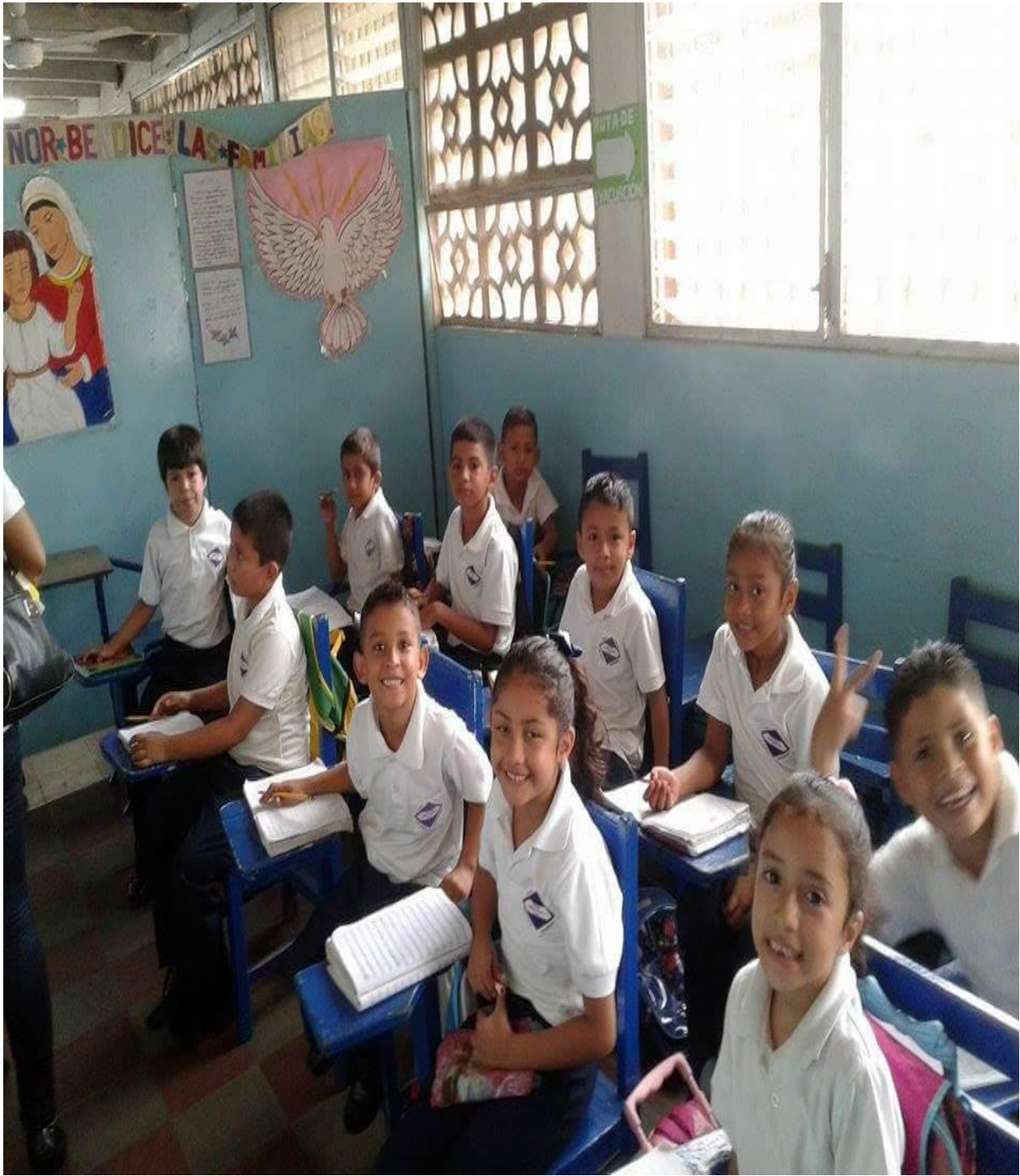
Estudiantes de Primer Grado "A"