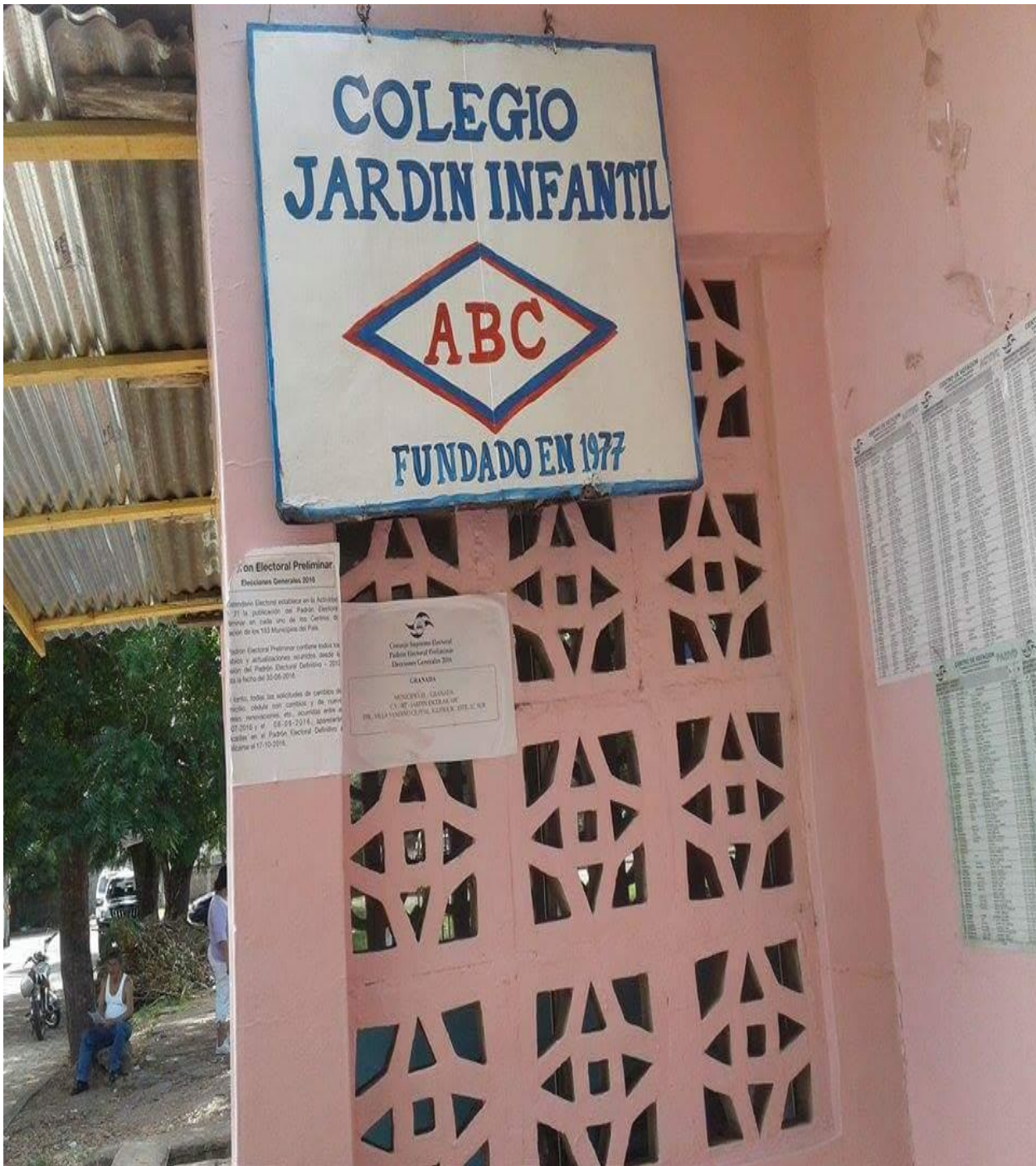
Frente del Colegio Jardín Infantil ABC