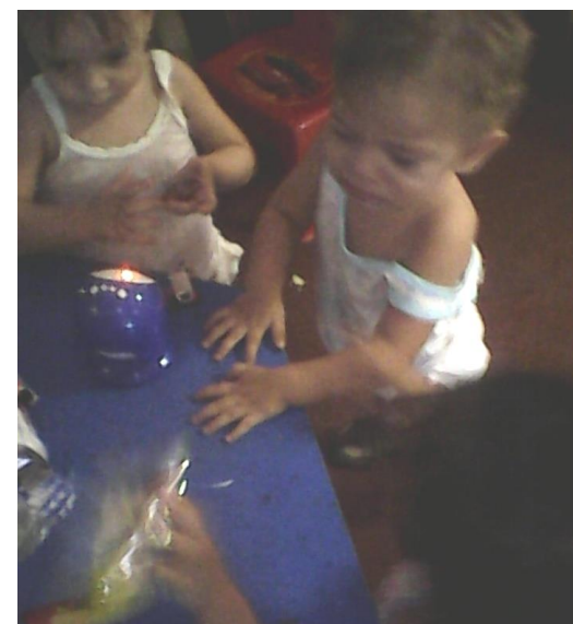
En este plan de acción trabajamos con un grupo reducido para brindar oportunidad de atención individualizada podemos ver a los niños interactuando aunque por breves momentos (obsérvese a los niños seleccionados)