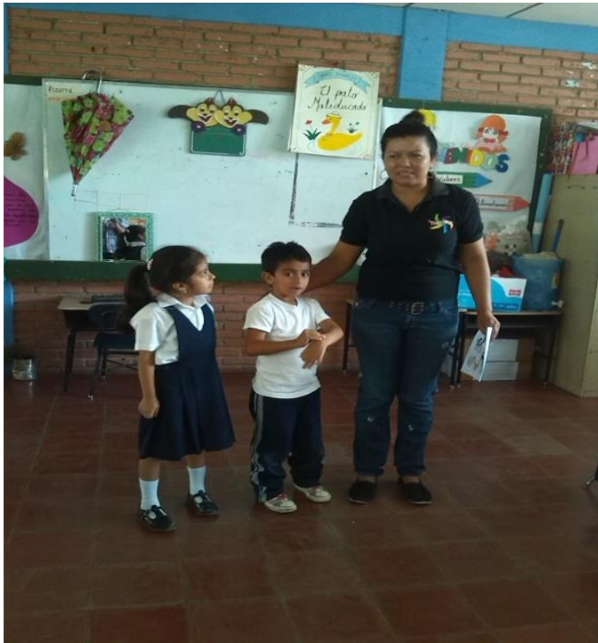
Niños narrando un cuento