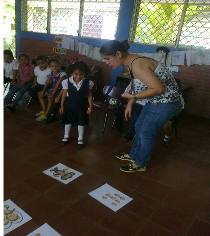
Estrategia Secuencia de Laminas