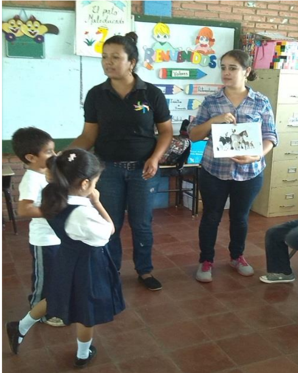
Adaptación del Cuento "Caballito Malcriado"