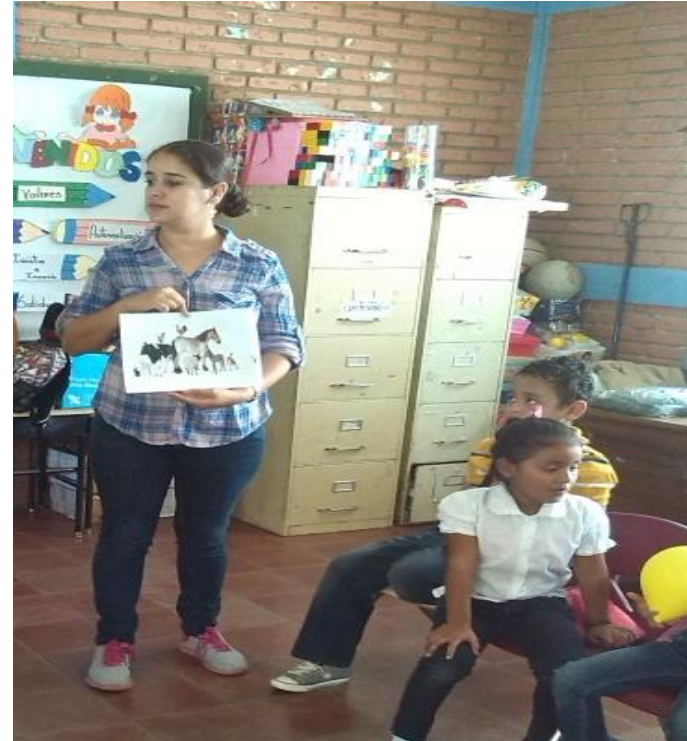
Adaptación del Cuento "Caballito Malcriado"