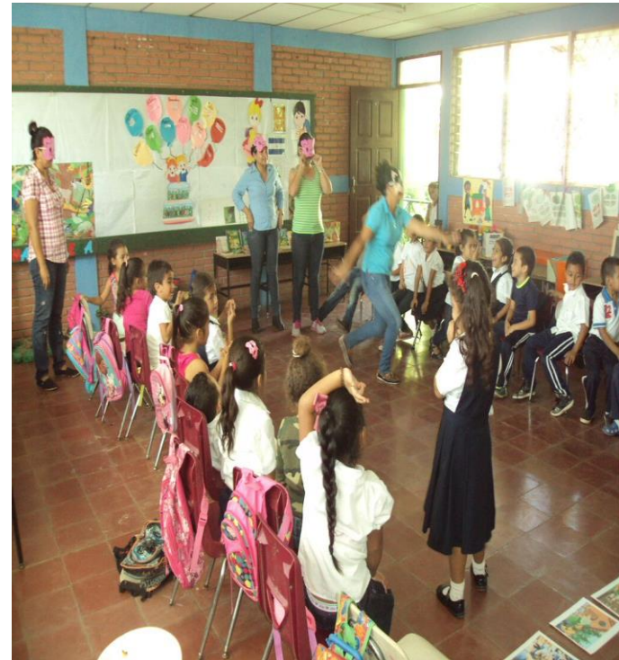
Cuento los tres Cerditos