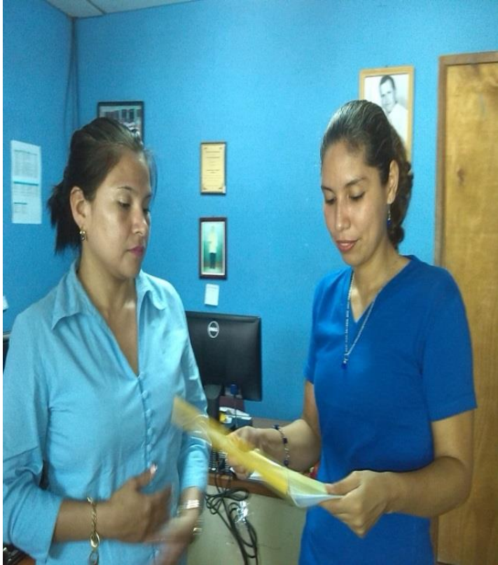
Entregando Antología a la Directora