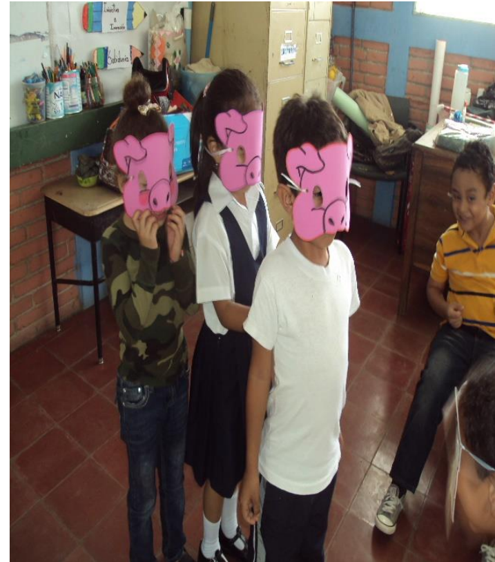
Dramatizando Cuento Los tres cerditos