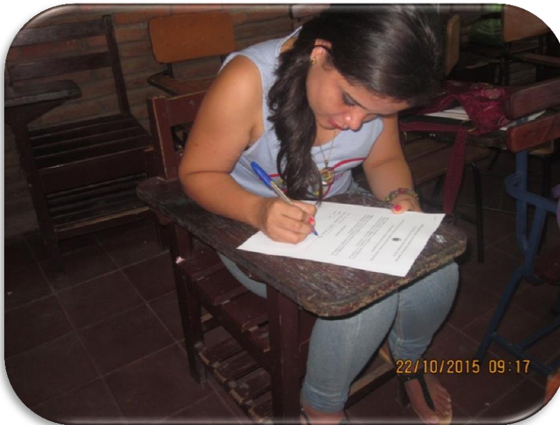
Entrevista a estudiante