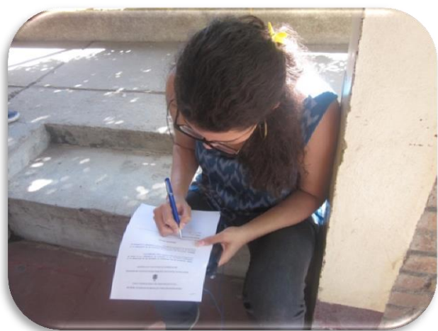
Encuesta a estudiantes