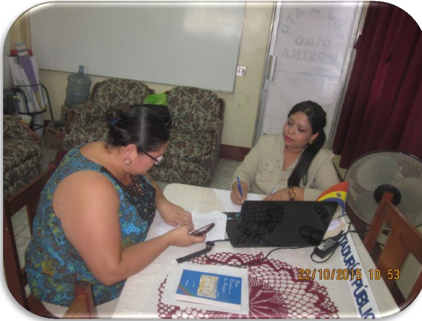
Entrevista a Docente