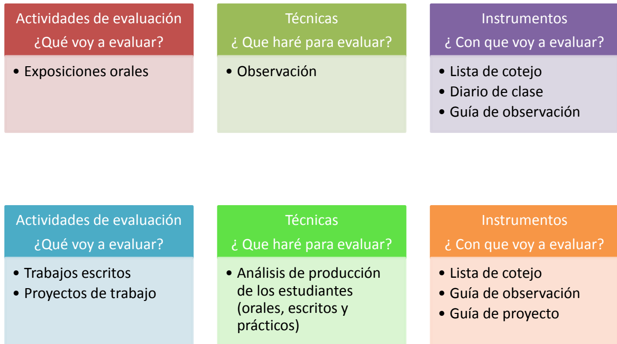
Figura Nº 1: Actividades, Técnicas de Instrumentos de Evaluación (Elaboración propia)

Cada uno de estos factores influye directamente sobre el juicio del docente, por lo que respecta a la elección de un instrumento o una combinación de actividades, técnicas e instrumentos. Por ejemplo, de acuerdo a los objetivos cuyo grado de cumplimiento se quiere evaluar, no se puede elegir aleatoriamente cualquier instrumento de evaluación, puesto que, no miden de forma equivalente el trabajo intelectual de los estudiantes.