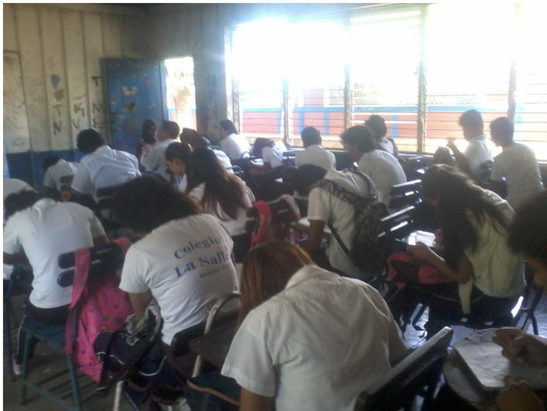
realización de las diferentes actividades tales como: mapa sol, línea de tiempo.