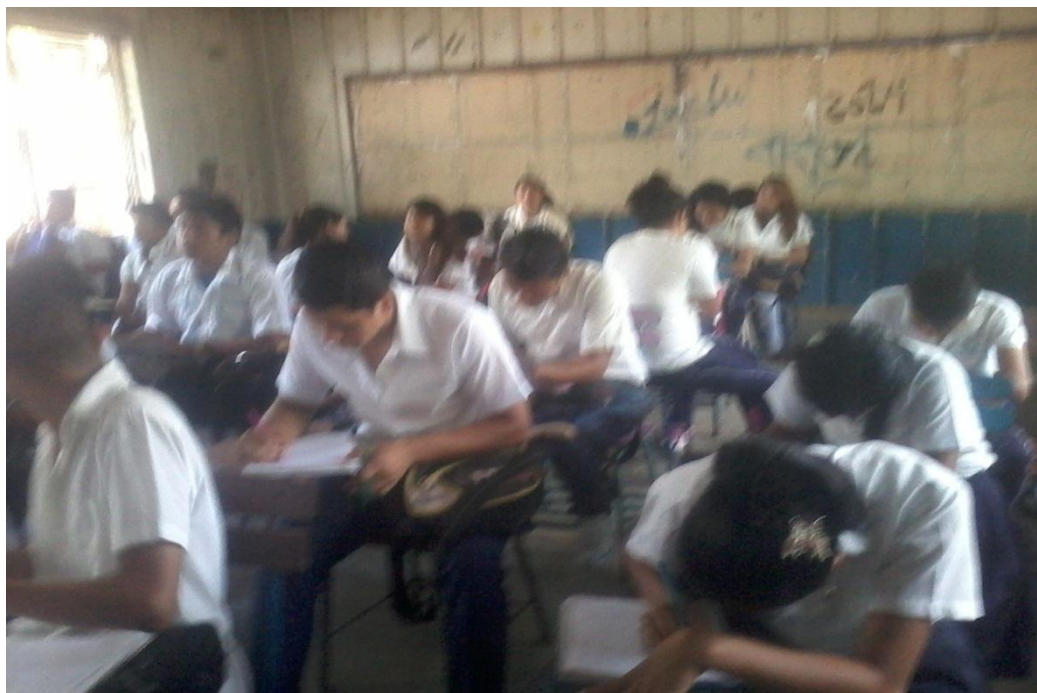
Realización de prueba diagnóstica.