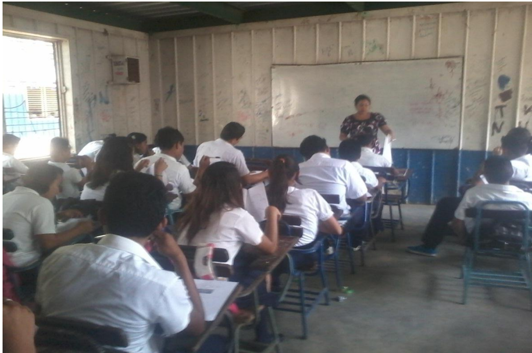
Presentación del tema por medio de la unidad didáctica.