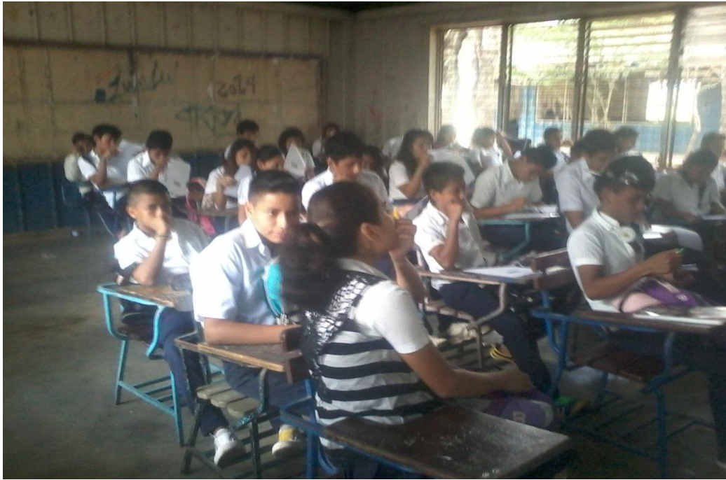
Atienden a las orientaciones de las actividades a realizar en clase.