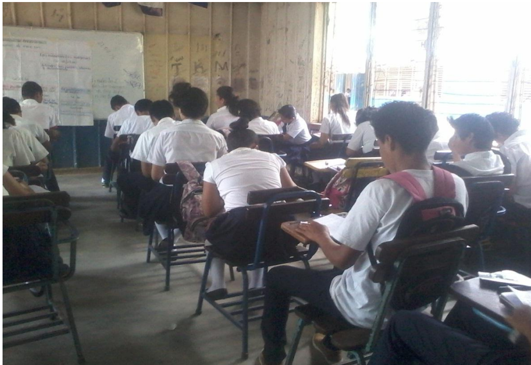
Presentación del contenido a través del gráfico mapa conceptual.