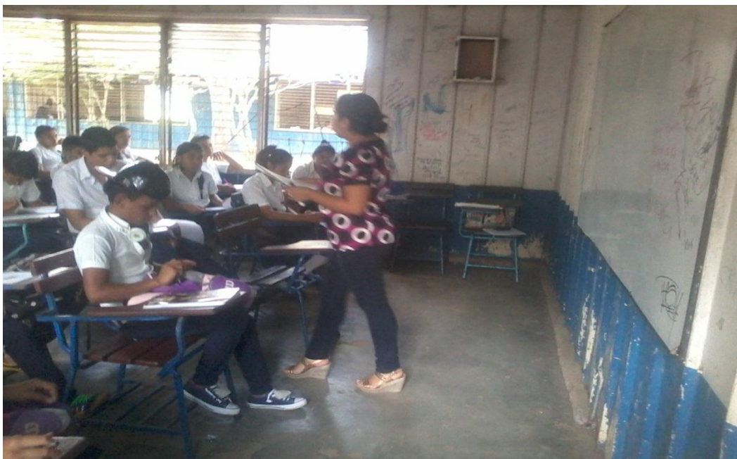
Explicación de la prueba diagnóstica.