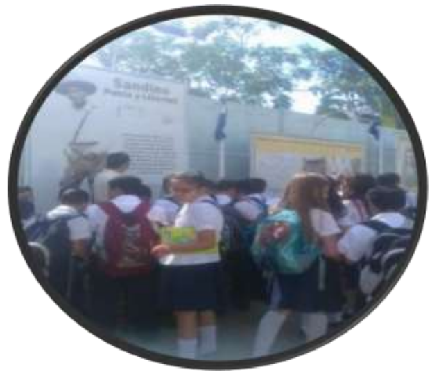
De paseo en la Asamblea Nacional y en el Mirador Salvador Allende