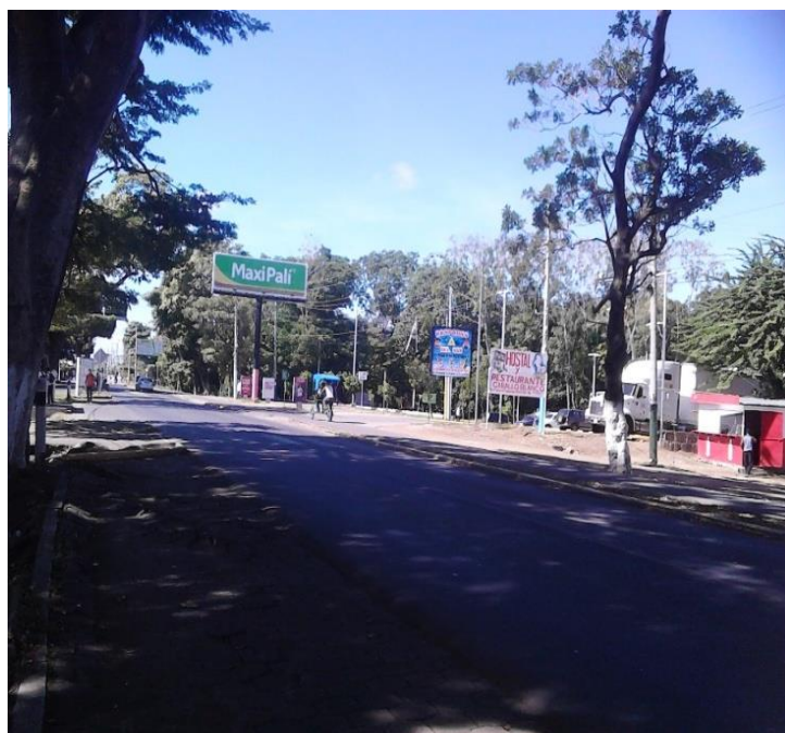
Carretera Panamericana, costado este del colegio

El centro escolar tiene una posición geográfica privilegiado, ya que justo a la par del centro está la carretera Panamericana, que conecta nuestro país por la parte sur con Costa Rica, cerca del mismo se encuentran gasolineras, el supermercado Maxi Palí, el estadio de Rivas Yamil