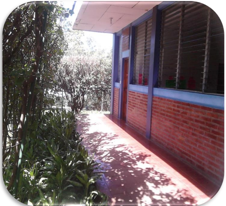
Aula de sexto grado B, a la par oficina de la hermana encargada de primaria

A la izquierda del aula de clase está el sexto grado A y a su derecha la oficina de la encargada del sector primaria, al frente del aula esta una zona de descanso para maestros o para estudiantes totalmente arborizado y con mesas de concretos y cerámica, el entorno del aula se encuentra ornamentado y cuenta con un bebedero de agua al frente de aula el cual es compartido con sexto grado A para que los estudiantes no tengan que ir lejos a tomar el vital líquido.