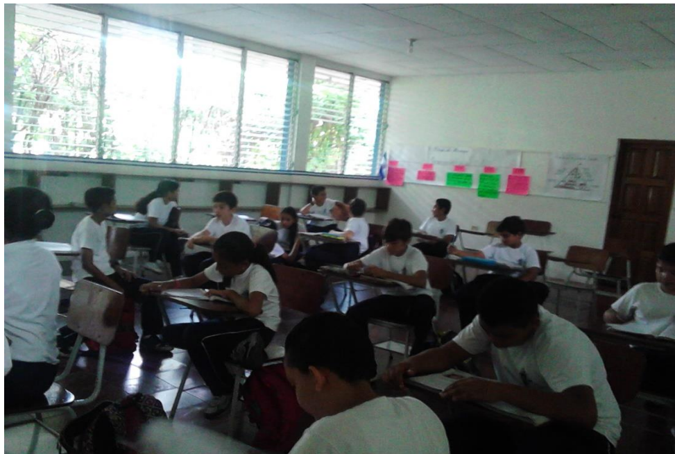
Alumnos de sexto grado en clase de Lengua y Literatura

En los primeros 45 minutos de la clase del segundo día observado se pudo notar que la maestra realizó un plenario en el que los estudiantes participaron activamente y realizaban inferencias y juicios valorativos de lo leído, hubo ejercitación de habilidades de comprensión lectora, los estudiantes analizaron, explicaron, discriminaron e interpretaron mientras la docente leía y conforme realizaba las preguntas del texto, pero se perdió la dirección de la clase cuando la maestra se retiró para hacer otras actividades que no corresponde con su labor de docente, por lo que es oportuno analizar cómo afecta que la dirección o administración de un colegio utilice a los docentes para realizar actividades fuera de su labor ya que este grupo de alumnos se quedó solo, sin el facilitador que los guiara al aprendizaje porque la docente debía cumplir con otras responsabilidades