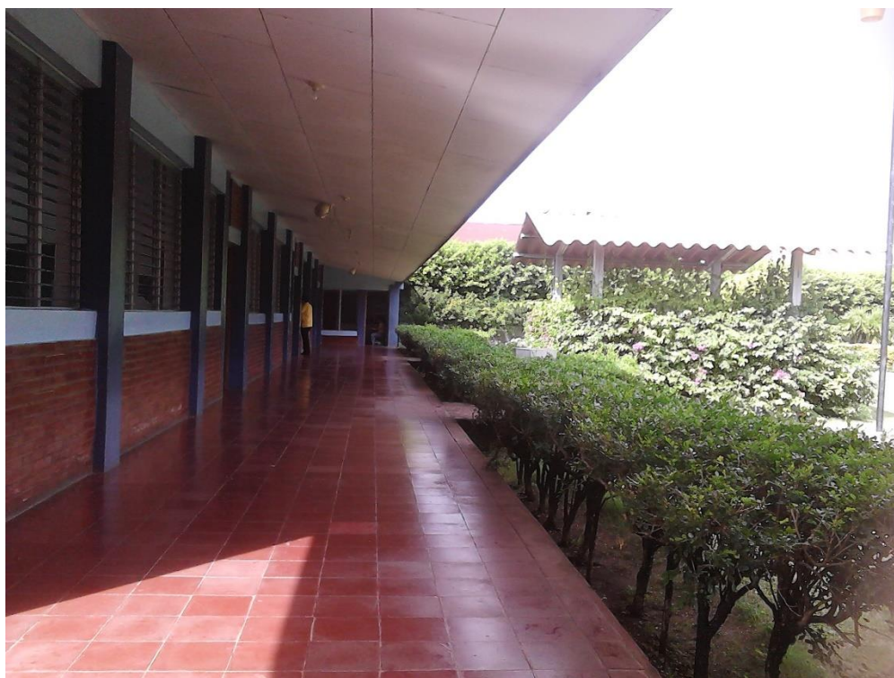
Pabellón de primer y segundo grado del colegio Nuestra Señora del Rosario de Fátima

El escenario del fenómeno en estudio se desarrolla en el Colegio Nuestra Señora del Rosario de Fátima, es un colegio privado de orientación católica fundado por las religiosas Hermanas Dominicanas de la Anunciata de la ciudad de Rivas, está ubicado en el municipio de Rivas, departamento de Rivas, el centro cuenta con una ambiente cómodo, arborizado y ornamentado, atienden las modalidades de educación pre- escolar, primaria y secundaria, el colegio tiene su propia librería y comedor dentro del centro para que los estudiantes compren durante la hora de receso, la infraestructura se encuentra en un excelente estado, y con espacios recreativos y amplios para los docentes y estudiantes, cuenta con una iglesia dentro del mismo para la celebración del Santísimo.