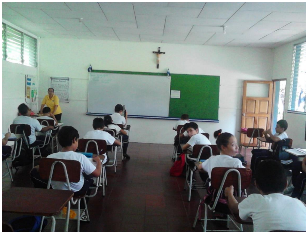
Anexo 7: Estudiantes de sexto grado en la clase de Lengua y Literatura