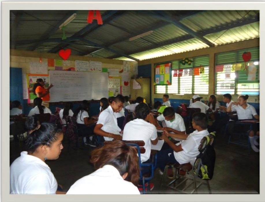
Estudiante mal organizado a la hora de la orientación por parte de la docente.