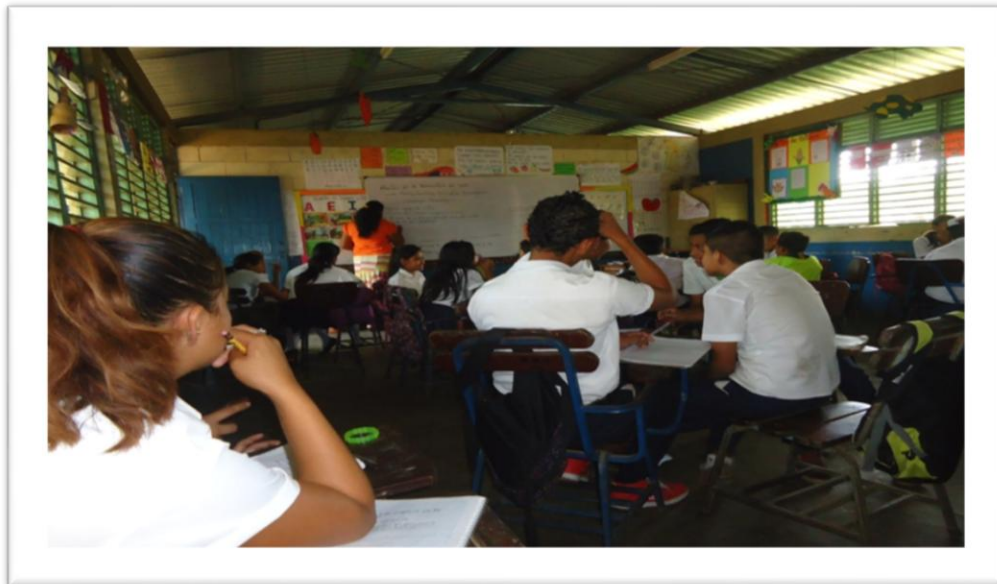
Mala organización del aula de clase.