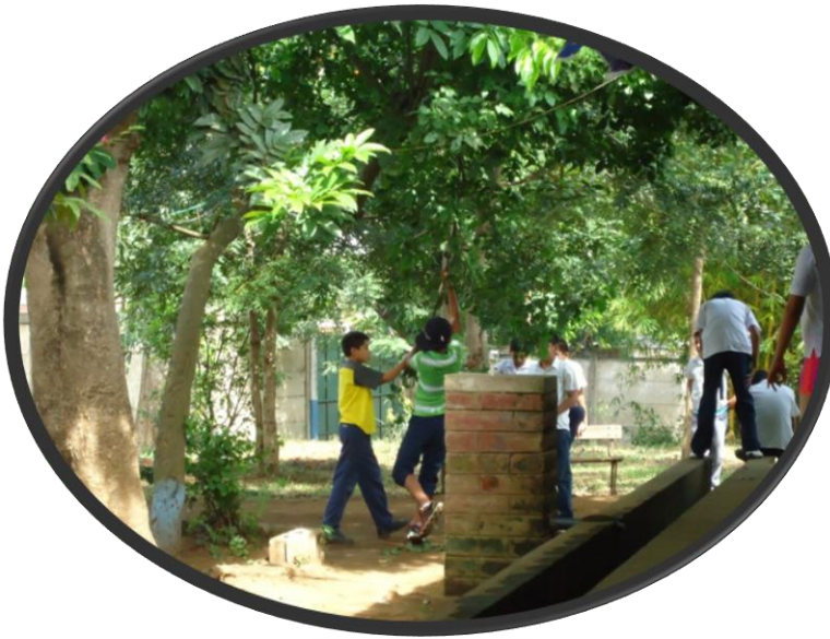
Estudiante realizan destrucción de las plantas en el receso y no se observa supervisión de ningún docente.