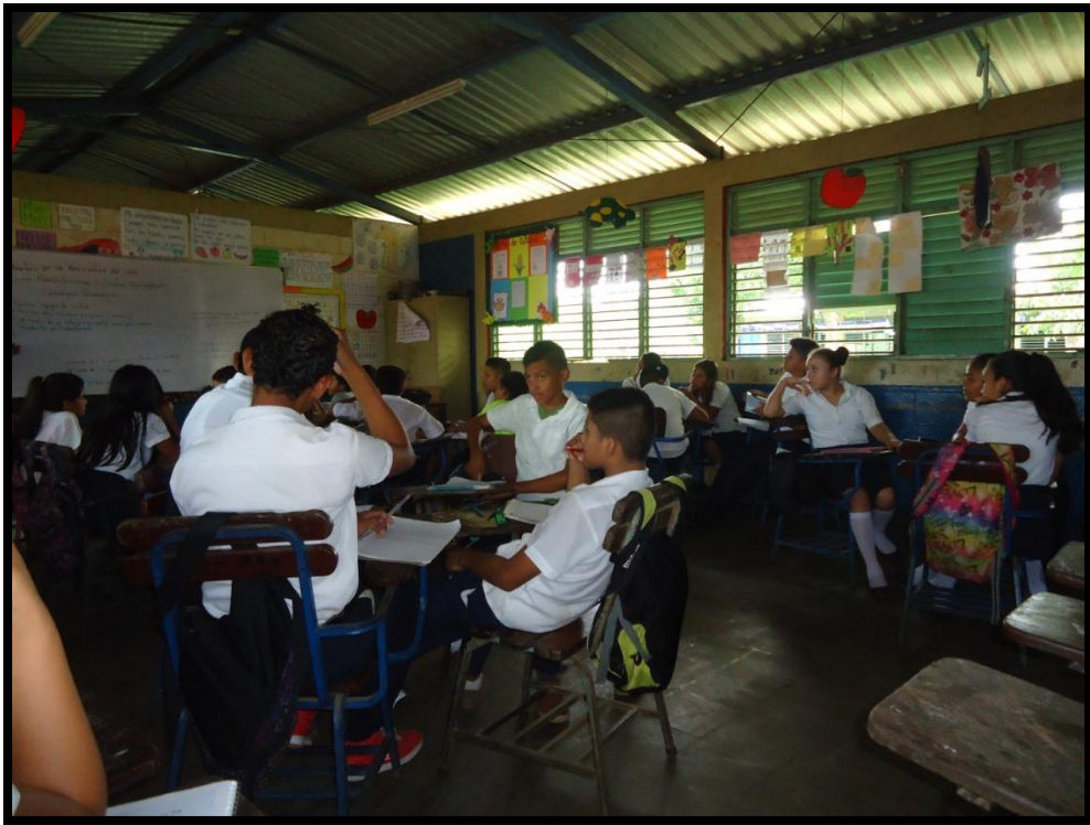
Estudiante conversando a la hora de la explicación por parte de la docente.