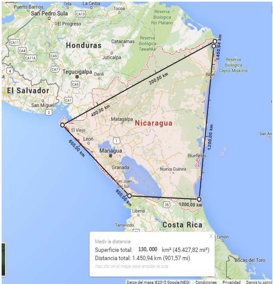
Ilustración 2: Medición de la extensión territorial de Nicaragua.

Hacemos Clic derecho sobre el mapa, luego damos la opción medir distancia y elegimos el lugar de dónde a dónde vamos a medir.