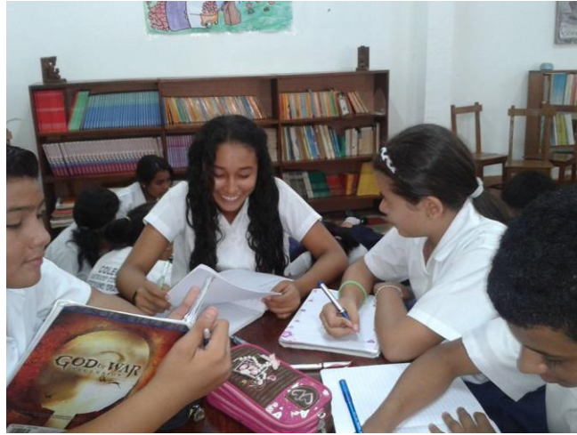
Estudiantes disfrutando de trabajo en equipo.