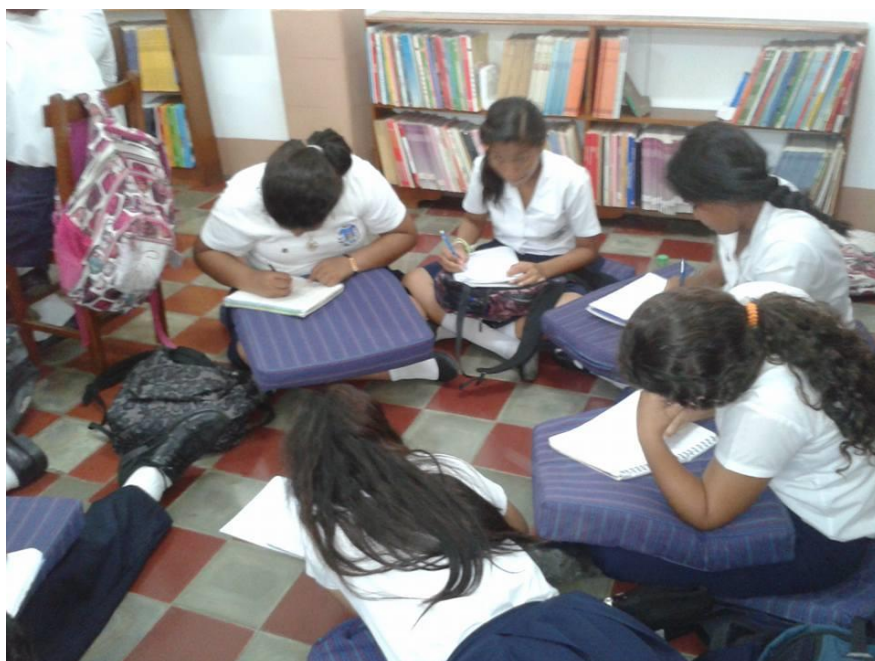
Estudiantes en biblioteca trabajando redacción de textos.