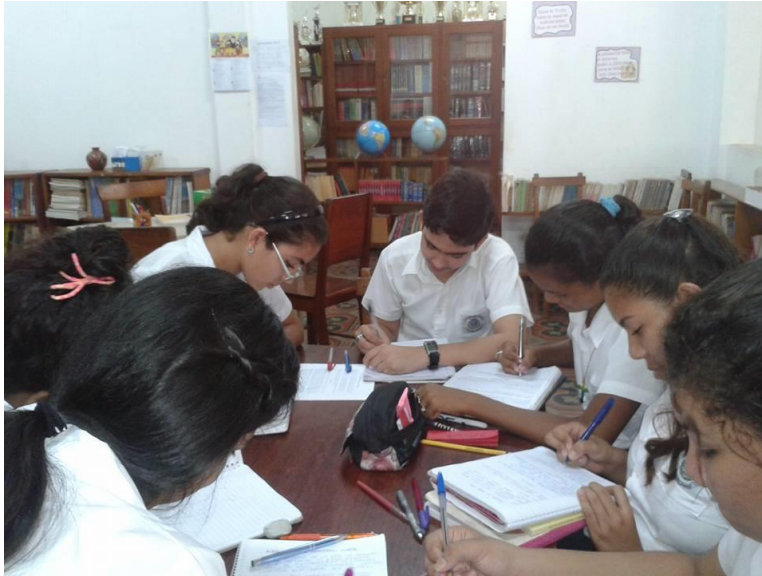
Resolviendo asignaciones investigativas en la biblioteca del colegio.