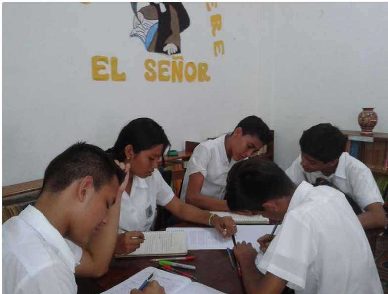
Lectura comprensiva de textos científicos.