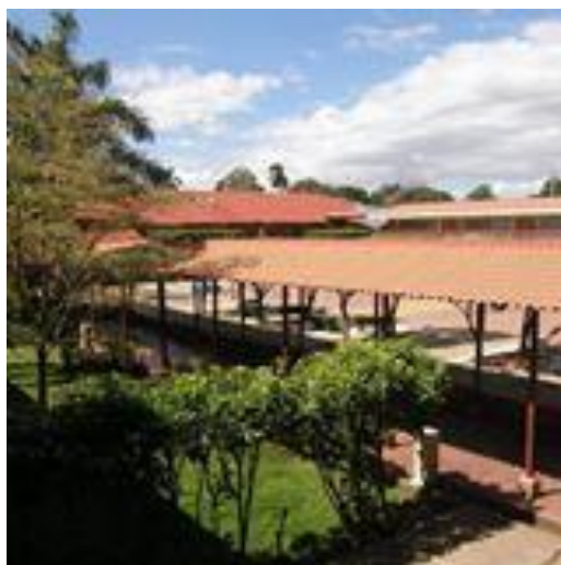
Colegio Sagrado Corazón, Teresiano-Granada