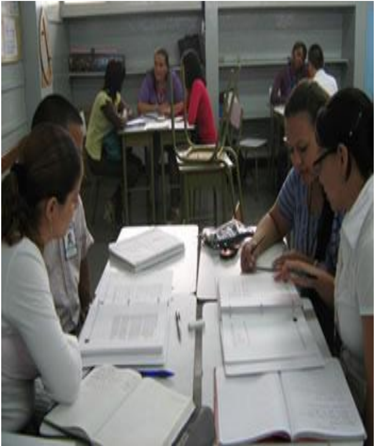
Estudiantes realizan indagacion cientifica