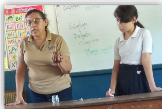
Ilustración 5 Implementación de estrategias propuestas en el manual

Durante la segunda visita la docente empleó el debate como estrategia metodológica basada en el aprendizaje cooperativo, para ello organizó el aula colocando a los estudiantes en cuatro hileras en forma de u, después los enumeró del 1 al 4 y explicó que cada hilera era un equipo, luego tenían que comentar una pregunta por equipo y que lograran un concepto entre ellos. Seguidamente ellos contestaron mientras la maestra los llamaba por números. Al finalizar todos debían debatir sus respuestas diferentes de la pregunta asignada.