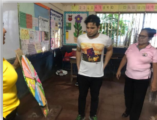
Implementación de estrategias