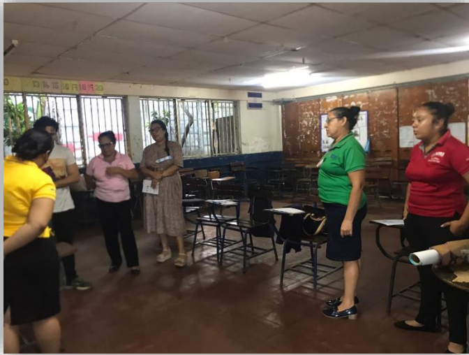
Inicio del taller