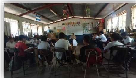
Ilustración 4 Visita al cuarto grado

Este seguimiento se hizo con tres visitas al colegio en el aula de cuarto grado. En la primera visita se pudo observar que la docente realizó dos técnicas que fueron: “canasta revuelta” la cual fue implementada al inicio de la clase para recordar el tema anterior, y la otra fue el “globo explosivo” que se realizó en la conclusión de la clase para contestar preguntas de razonamiento del tema. De igual manera implementó la estrategia facilitada en el manual “discusión en pares”. Como resultados obtenidos se puede decir que hubo organización de los estudiantes en el salón de clases, generaron interés y deseo de aprender de la clase, se promovió la participación y aprendizaje vivido de sus experiencias.