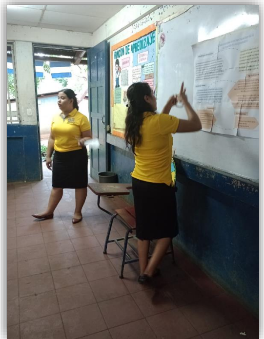
Breve explicación teórica