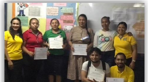
Ilustración 3 Entrega de diplomas a los participantes