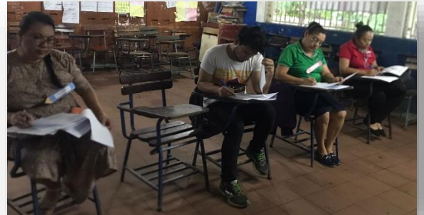
Ilustración 1 inicio de la capacitación

Finalmente se dieron palabras de cierre y agradecimiento a los participantes, se compartió