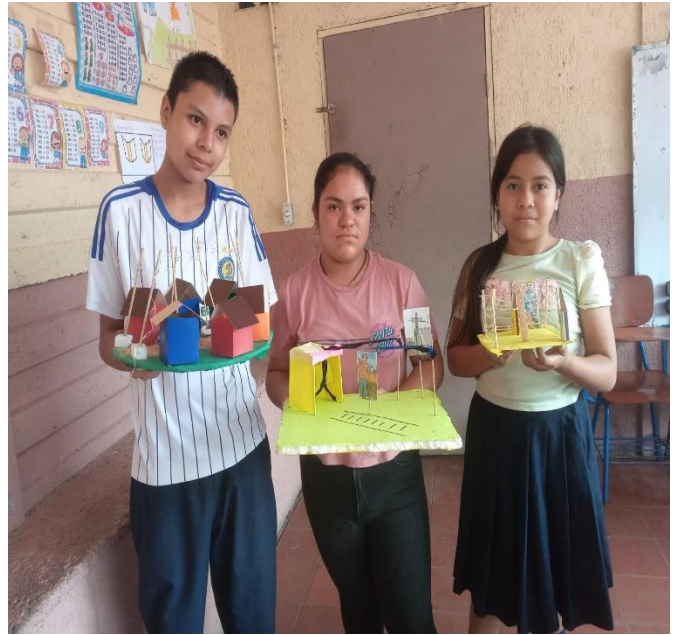
Figure 4 Elaboración de materiales guiado por la docente