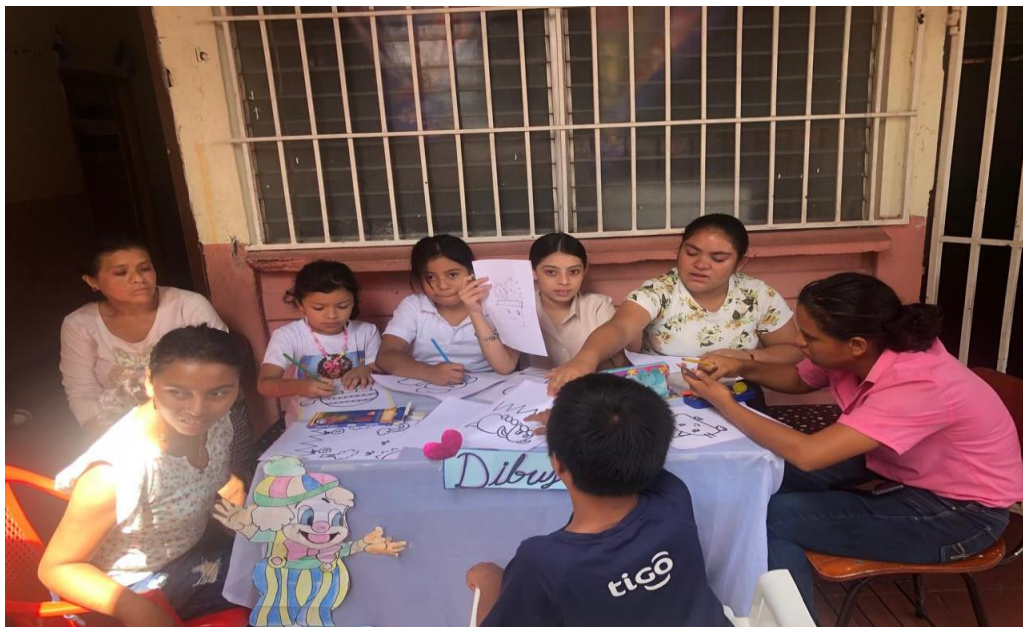
Figure 6 participación e involucramiento de las actividades orientadas desde el centro