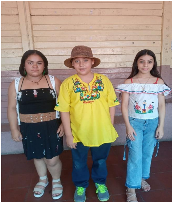
Figure 1 Estudiantes de 4to Intelectual participando en actividades del centro