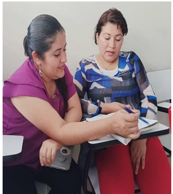
Figure 2 Explicando el instrumento, entrevista