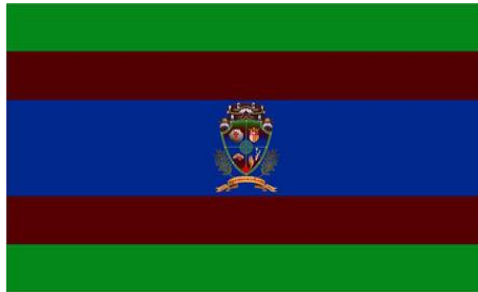
Bandera de Sébaco