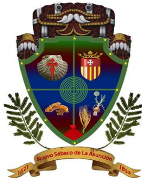
Escudo de Sébaco

El escudo representa el cultivo del arroz y cebolla (Hortalizas)