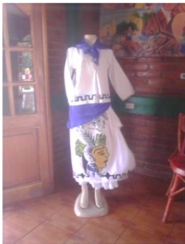
Foto del traje de Sébaco

Fuente: caracterización socio- económicas( 2017), recuperado el 26 de febrero