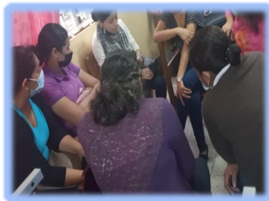
Ilustración 5 Grupo Focal realizado con docentes.

Los educadores, al ser consultados en grupo focal, respecto a por qué razón consideran son importantes las habilidades sociales complejas en el entorno escolar, coinciden en que son herramientas indispensables en el quehacer escolar, ya que hacen posible establecer conexiones duraderas con los educandos y posibilitan un ambiente sano de convivencia en el aula.