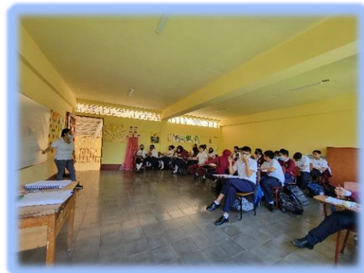
Ilustración 7 Sesiones de observación

En las tres sesiones se pudo observar que más de tres docentes aplican estrategias para evaluar el comportamiento, algunas de ellas están dadas por el centro, otras son a manera de autoevaluación, promoviendo en el estudiante una conciencia de su propio comportamiento; llamando así a su reflexión y análisis para un cambio positivo.