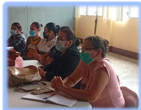
Ilustración 4 Grupo Focal Aplicado con docentes

Respecto a lo antes citado, en el desarrollo del grupo focal se plantearon aspectos como el hecho de que muchas veces cuando se es estudiante se centra más en aquellas materias que le son más indispensables para la carrera y se deja como un relleno aquellas que en ese momento no se valora de relevancia, pero luego en el ejercicio docente se enfrentan con la importancia de estas asignaturas en las que se promueve el desarrollo de habilidades para la vida y la profesión. Otros plantearon la importancia de que la Universidad y la Escuela Normal aborde estos temas con los aspirantes a docentes para crear en ellos un anhelo de crecimiento personal en cuanto a este aspecto de su vida profesional.