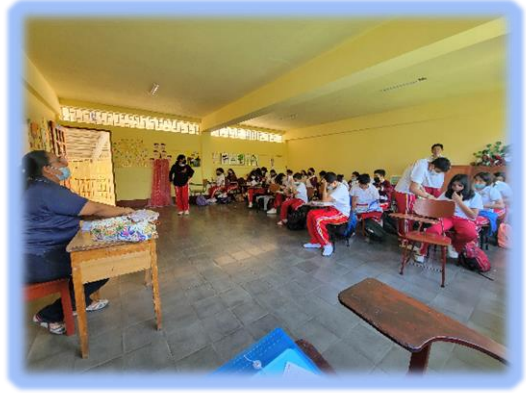
Ilustración 6 Sesiones de Observación

Existe relación entre los factores que condicionan el comportamiento y la práctica de habilidades sociales, estos factores que abruptamente cambian el comportamiento, pueden modificar el objetivo de aprendizaje dispuesto por el docente. Durante el proceso de observación, se constató que el docente trata de llegar a los estudiantes a través de una comunicación efectiva de sus propósitos