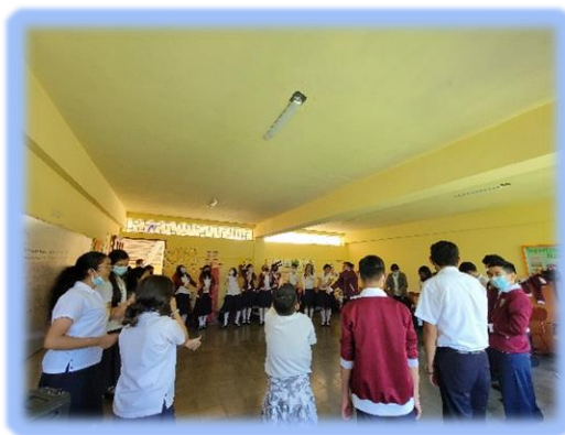
Ilustración 3 Sesiones de observación

Los educadores coinciden en que las principales HSC que poseen son: empatía, asertividad, capacidad de escucha, así como modulación de la expresión emocional; siendo menos evidente el mencionar aspectos como la inteligencia emocional, capacidad de comunicar sentimientos y emociones.