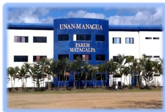
Ilustración 1 Fuente: unan.edu.ni. UNAN FAREM Matagalpa

El presente estudio se realiza en dos ámbitos institucionales, el primero es la UNAN – FAREM Matagalpa y su enlace con docentes del Colegio Santa Teresita del municipio de Matagalpa