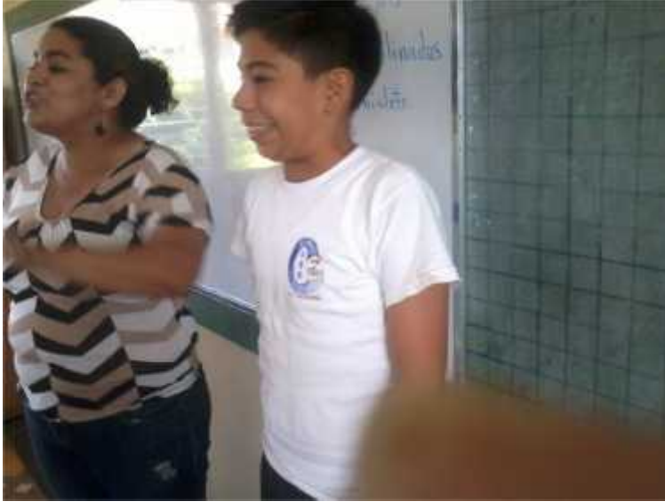
APLICACIÓN DE NUEVAS ESTRATEGIAS