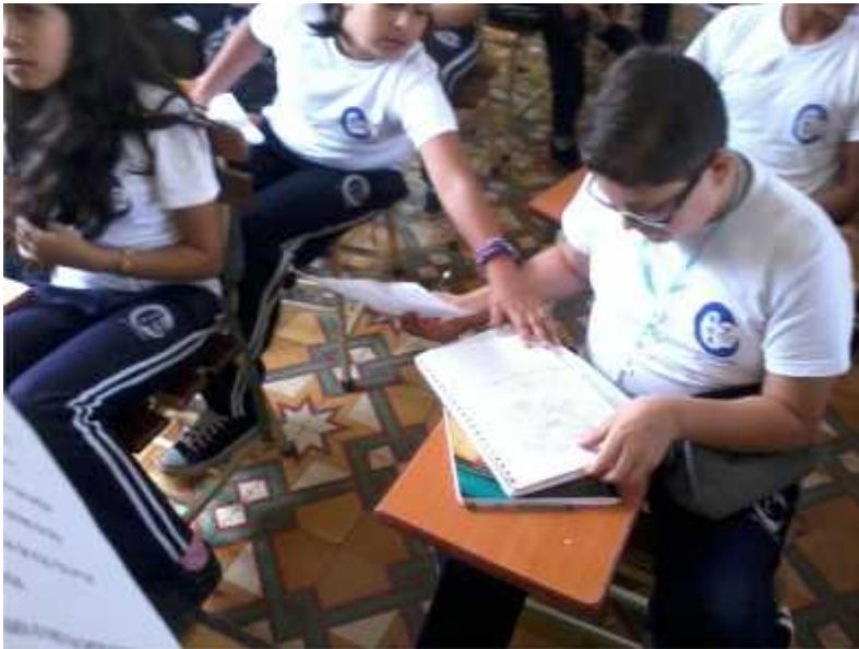
ENTREVISTA A ESTUDIANTES.