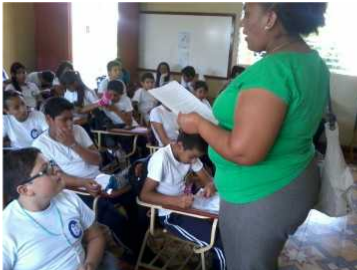
REFLEXION ASAMBLEA DE LA CARPINTERIA