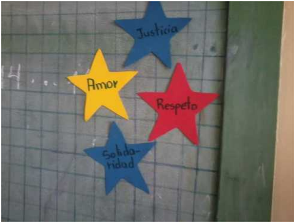
ESTRATEGIA ALCANZAR UNA ESTRELLA.