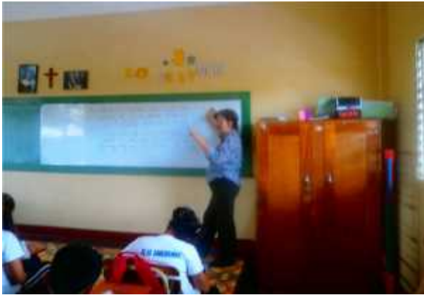
EXPLICACION DE LA DOCENTE.