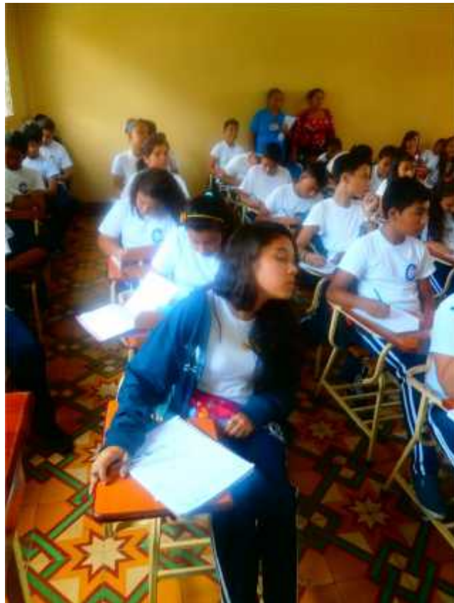
OBSERVACION DE LA CLASE.