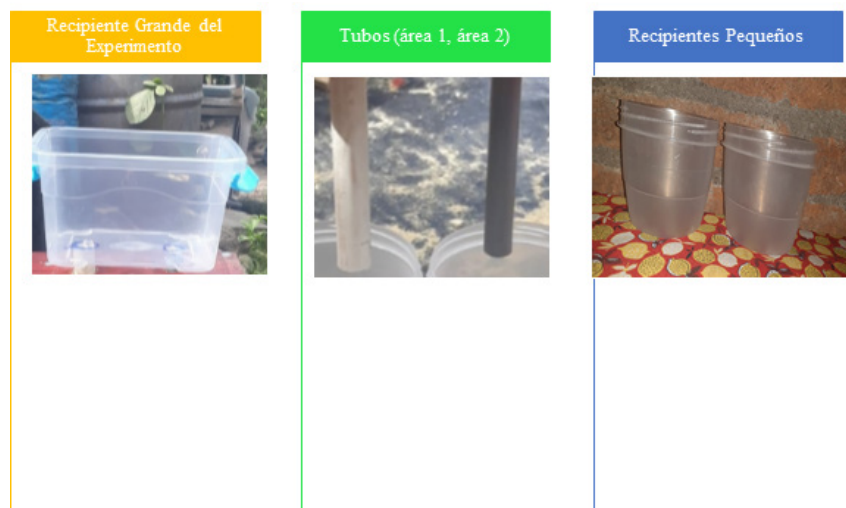
Creación Propia, obtenida de SmartArt 2024