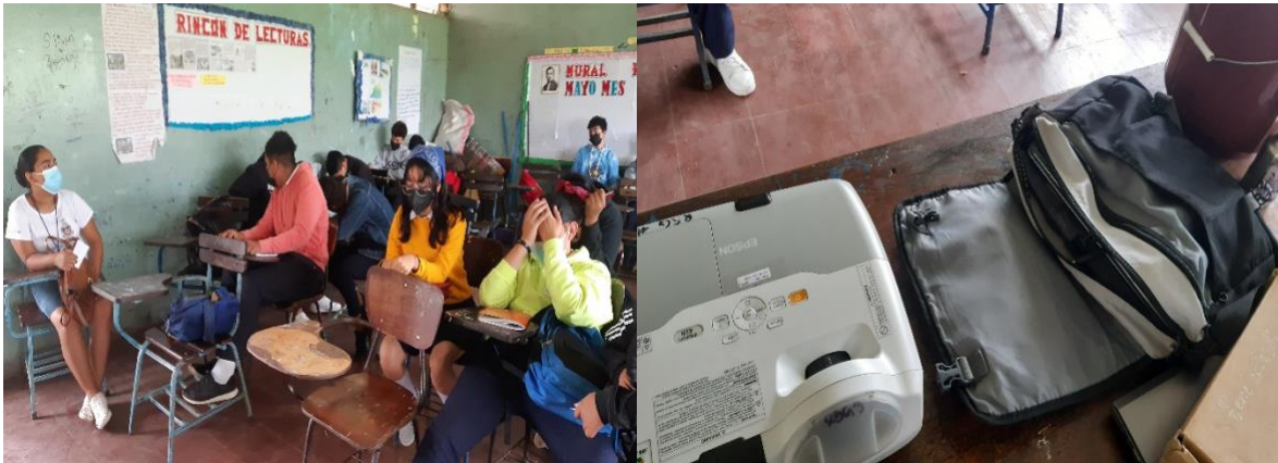
Sesión de presentación de video interactivos//instalación y presentación