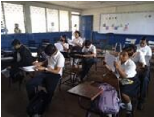
Aplicación diagnóstico inicial