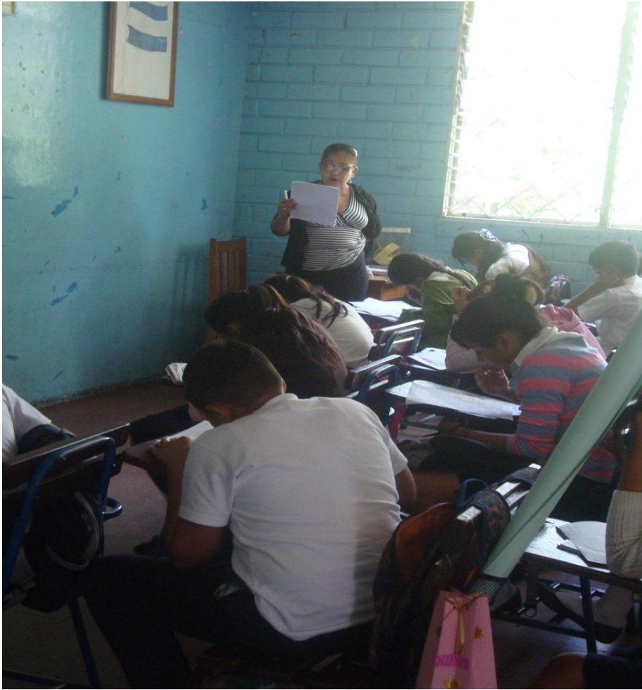
Docente de Lengua y Literatura del séptimo grado “A” explicando actividades a realizar a través de la estrategia mapa del cuento.