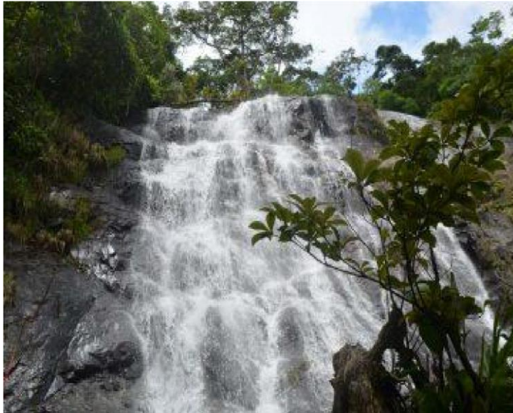
Figura:15 cascada La Golondrina

Es una majestuosa caída de agua que nace de las profundidades del cerro, aquí se observan centenares de golondrinas, de ahí su nombre. La cascada forma otras que atraviesan la ciudad de Río Blanco, originando así el nombre de este hermoso municipio.