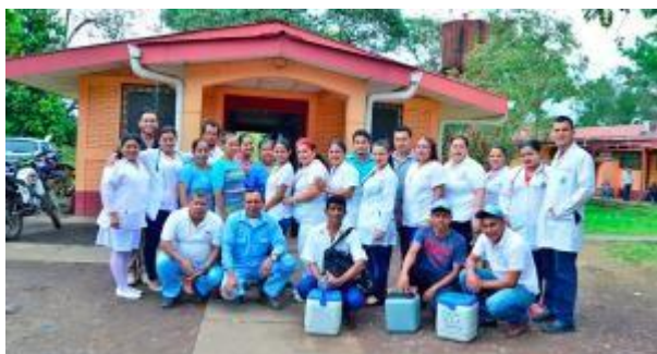
Figura 14. Empleados de la salud de Rio Blanco

Las causas de consulta más frecuentes son: enfermedades respiratorias, diarreicas, enfermedades de la piel, parasitosis, control de embarazo, anemia, malaria, y artritis.