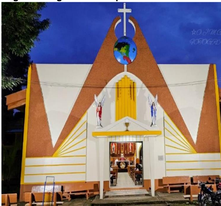
Figura: 16 Iglesia Parroquial

El templo actual es una estructura de concreto, con amplio atrio en su entorno. Su frontis es de estilo moderno y forma rectangular, acceso por una sola puerta cuadrada custodiada por ángeles en el pórtico. La fachada está decorada con una representación de una montaña coronada por la imagen del globo terráqueo