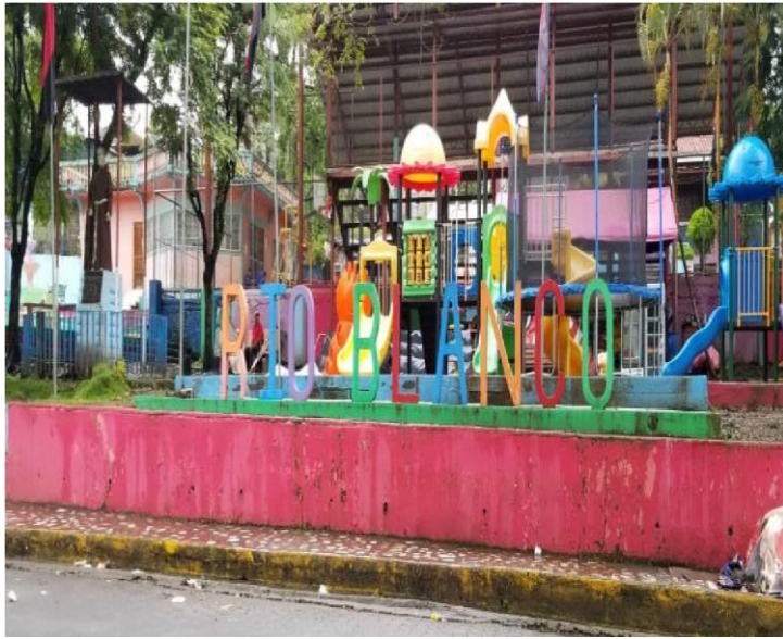
Figura: 20 Parque Central

Es un área de media manzana de extensión, usando una superficie quebrada que se aprovecha para ambientar varios niveles con andenes circundantes, quiosco, bancas para el descanso, cancha de básquetbol, dos áreas infantiles con diferentes tipos de juegos y áreas verdes espaciaosas, una calzada domingo Pepe en donde puedes caminar en familia.