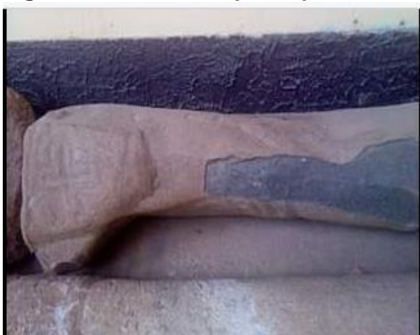
Figura : 17Cerámicas prehispánicas

El templo actual es una estructura de concreto, con amplio atrio en su entorno. Su frontis es de estilo moderno y forma rectangular, acceso por una sola puerta cuadrada custodiada por ángeles en el pórtico. La fachada está decorada con una representación de una montaña coronada por la imagen del globo terráqueo