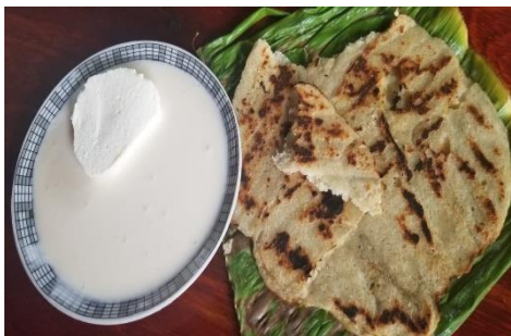
Figura No. 12: Gastronomía de Rio Blanco

La base de la alimentación del municipio es similar a la de los municipios aledaños y de la zona del pacífico, constituida principalmente por el consumo de frijoles rojos, arroz, maíz blanco y sus derivados, como la güirila, tamales, atol, pinol y las tortillas.