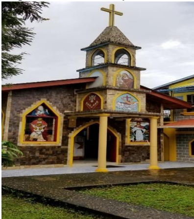
Figura 13: Parroquia Nuestra Señora del Carmen del municipio de Rio Blanco