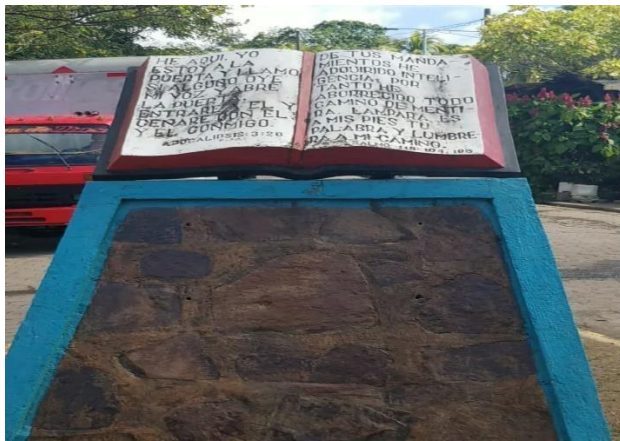
Figura: 21 Monumento a la Biblia

También se levantó en el Municipio de Rio Blanco un monumento alusivo a las festividades del día de la Biblia.