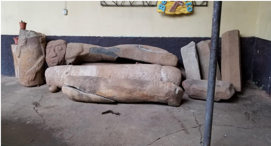
Figura 11: figuras geométricas, antropomorfas y zoomorfas