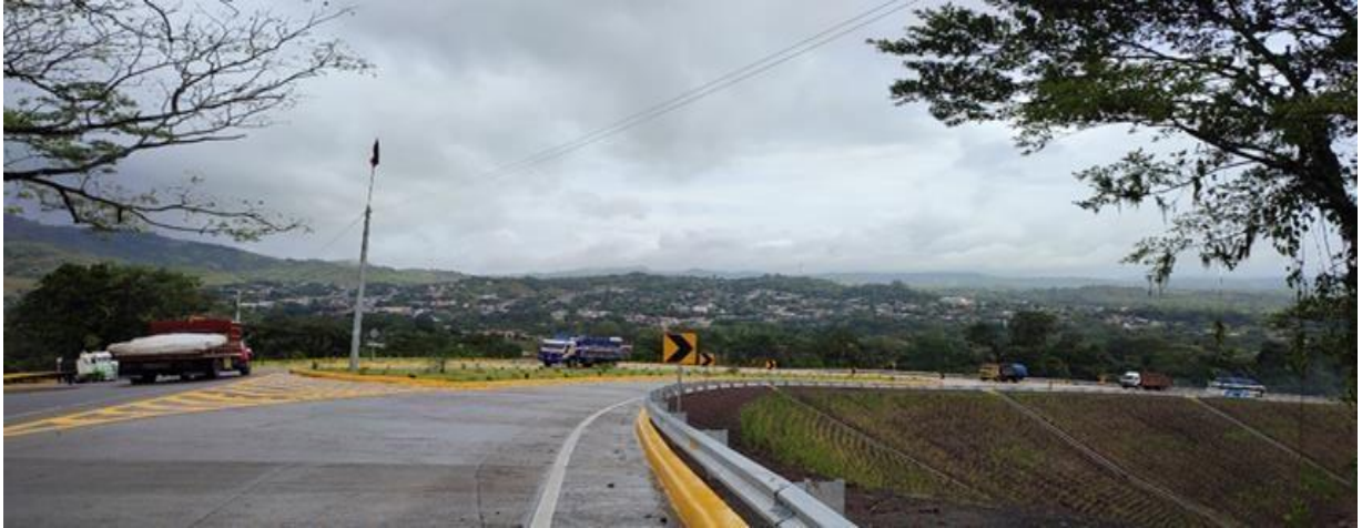
Figura N° 8: Circunvalación, entrada a la ciudad.