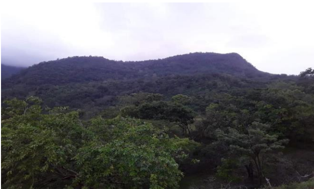
Figura 10. Cerro Musún

El municipio cuenta con la Reserva Natural Cerro Musun, fue declarada Reserva Natural, mediante Decreto 42-91, publicado en La Gaceta No 207 del 4 de noviembre de 1991. El decreto no establece los límites del Área Protegida.