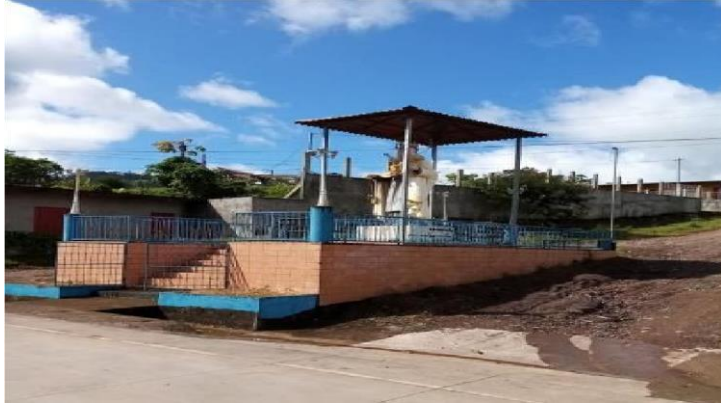
Figura: 18 Monumento a la Virgen Nuestra Señora del Carmen

Recientemente se inauguró este sitio de adoración, especialmente para quienes pagan promesas.