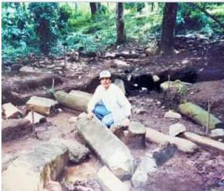
Figura: 19 Sitio arqueológico “La Quesera”:

Es un asentamiento prehispánico, que tiene plazas y más de 150 montículos, circulares y alargados. También hay artefactos utilitarios de piedra, petroglifos y esculturas antropomorfas de forma totémica, hechas en un solo bloque