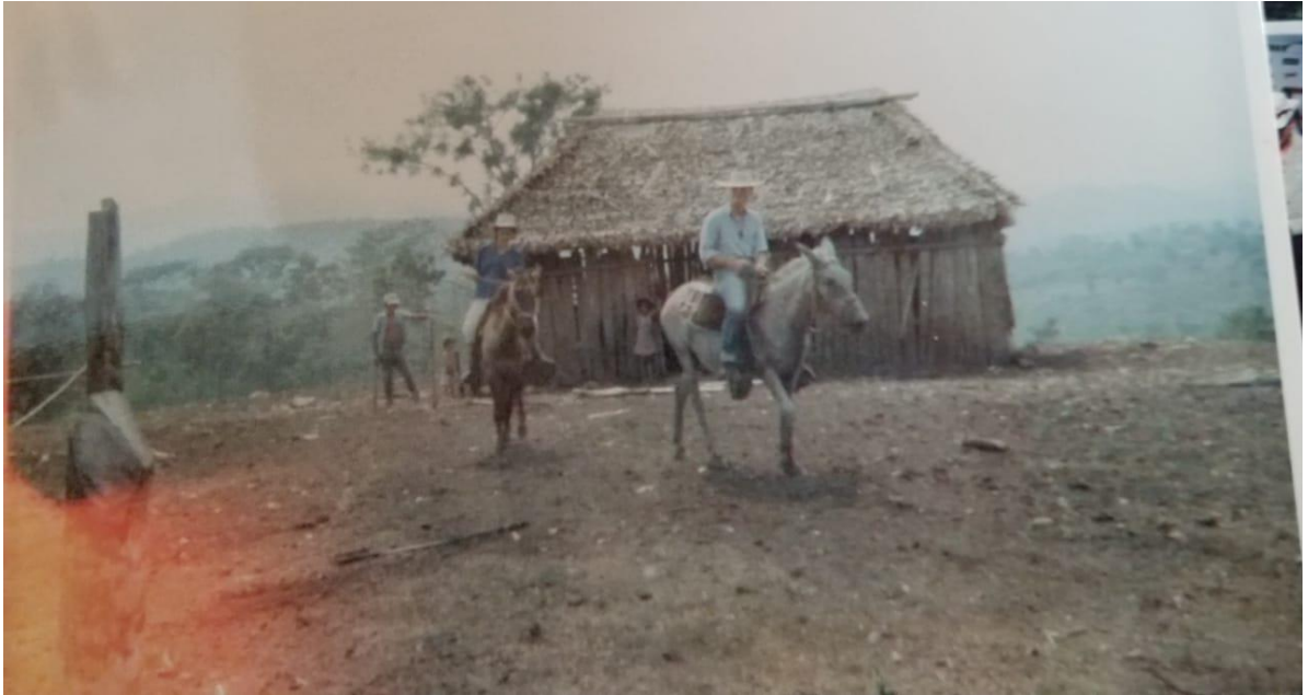
Figura N° 5 Primeras viviendas del municipio de Rio Blanco