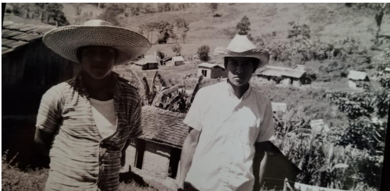
Figura N° 6: Antiguos pobladores del Municipio

El desarrollo de este municipio se ha logrado con la actitud positiva de sus pobladores en querer salir adelante y por el empeño y el esfuerzo que le ponen a su trabajo basados en la producción ganadera, agrícola por la que se caracteriza este municipio.