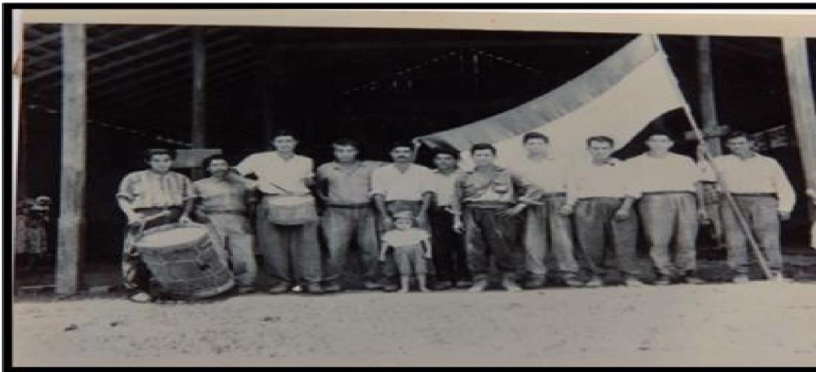
Figura 2. Miembros de la primera junta Directiva conformada en el municipio de Rio Blanco.

1974 la Asamblea Nacional Constituyente de la República, creó en la región sur Oriental del territorio de Matagalpa, el municipio de Rio Blanco, desmembrando el antiguo territorio municipal de Matiguas del mismo departamento de Matagalpa.