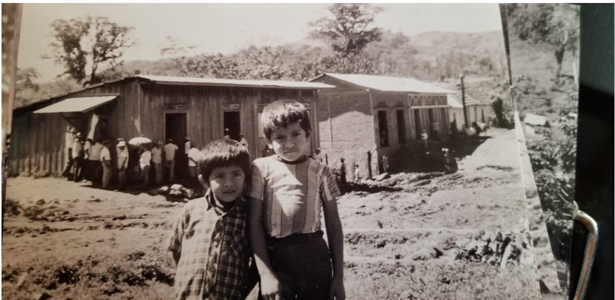
Figura N° 7: Zona rural del Municipio

El municipio es una zona urbana con su respectiva forma de organización y administración por el cual la función principal es gestionar los intereses de una comunidad darles seguridad alimentaria y de servicios de velar por los intereses de su población. En este municipio la población asegura que las calles son seguras a cualquier hora ya que cuentan con el apoyo de la policía, miembros de la alcaldía que atienden en tiempos de peligro por lluvias para proteger la vida de estos, las calles de este municipio, el parque, los negocios, son bien limpios e incluso el transporte de buses, taxi, y rutas están en buen estado y prestan un buen servicio.