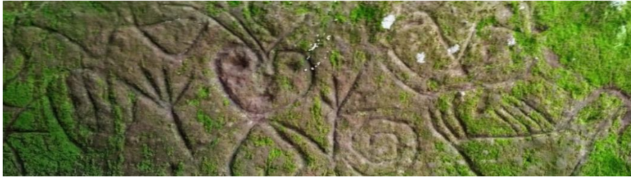
Foto 6 petroglifos Ubicados en la comunida Caño los Martínez 2

Son sitios u objetos que son considerados relevantes para la cultura, historia e identidad de una determinada sociedad, país o región.