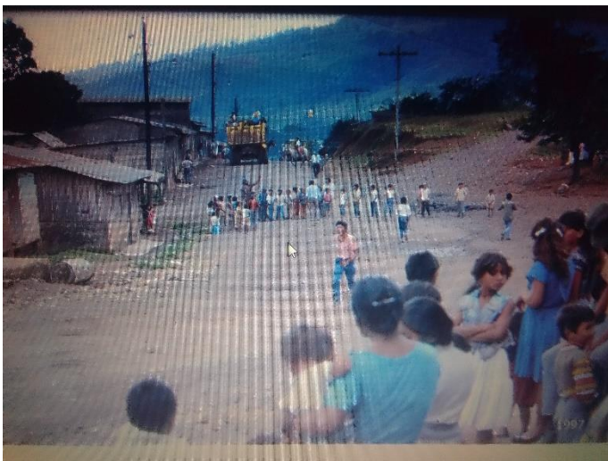
Foto 2 tomada de los archivos Historia de Waslala Alcaldía Municipal de Waslala

Como expresa la (CEPAL, 2000) organización territorial se refieren a un cambio en los esquemas de regulación, que cualifican y califican el alcance de acciones de ordenamiento, un cambio en las escalas de los territorios de referencia del ordenamiento y un mejoramiento de la participación de otros sectores, además del Estado, por lo que se refiere al planteamiento de políticas y al desarrollo y ejecución de las mismas.