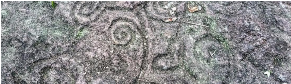
Foto 4 petroglifos Ubicados en la comunida Caño los Martínez 2

La gente de Waslala se desarrolla entorno a sus numerosos y caudalosos ríos, sus tradicionales