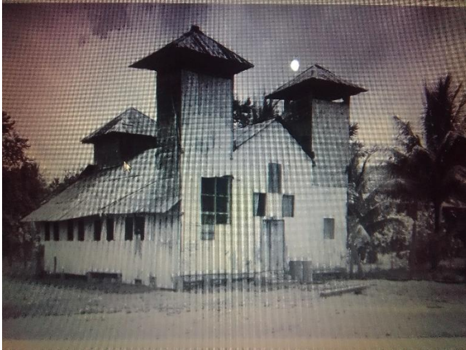
Foto 5 parroquia inmaculada concepción de María patrimonio sociocultural del Municipio

como el plástico, arquitectónico, urbano, arqueológico, lingüístico, sonoro, musical, audiovisual, fílmico, testimonial, documental, literario, bibliográfico, museológico o antropológico, requieren su conservación, rehabilitación y difusión, donde se cuente la historia, se validen sus recuerdos y se afirme y enriquezca las identidades culturales, y el legado común, confiriendo rasgos característicos a cada lugar. (UNESCO, 1972)