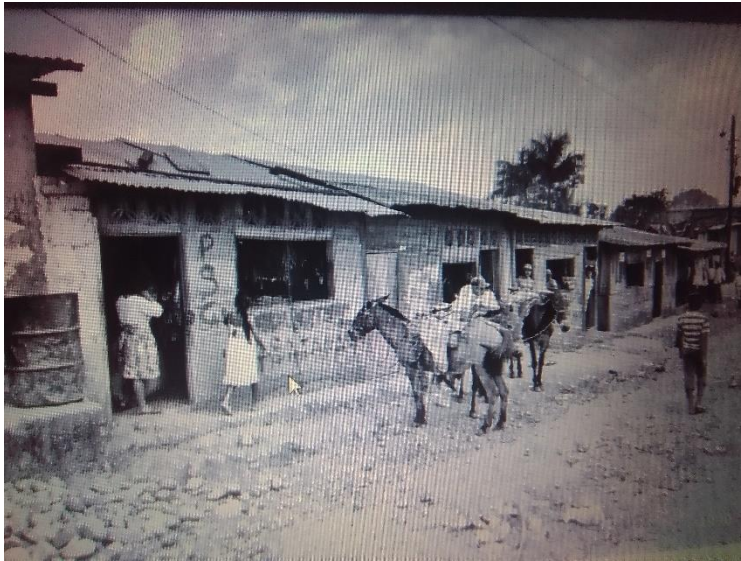
Foto 2 Primeros caseríos del municipio de Waslala años 1960

A partir de las conclusiones de (Vancouver, 1976) , la vivienda se entiende no sólo como la unidad que acoge a la familia, sino que es un sistema integrado además por el terreno, la infraestructura de urbanización y de servicios, y el equipamiento social comunitario dentro de un contexto cultural, socio-económico, político, físico-