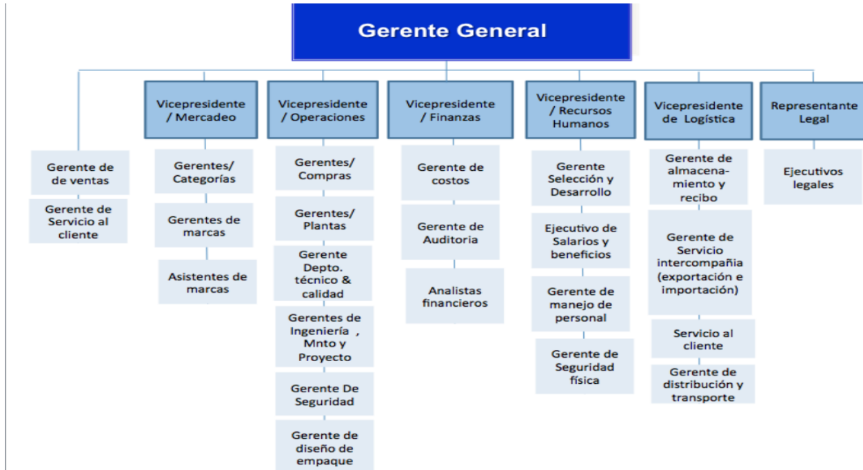
Diagrama de jerarquía institucional de SALMAR S, A

Nota Representación en diagrama jerárquico de SALMAR SA, se caracteriza por una cadena de mando clara y una línea de autoridad definida. Elaboración propia a partir de información proporcionada por gerencia de la compañía