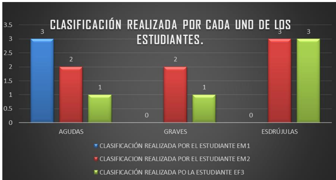
Grafica 2. Clasificación realizada por cada uno de los estudiantes.

Resultado del objetivo tres. Diseñar una propuesta didáctica, para el aprendizaje de la ortografía acentual.