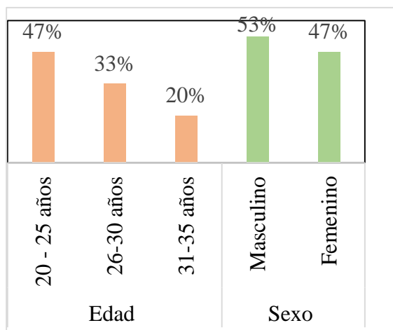
Figura 1 Edad-Sexo del personal que labora en oficina de empresa NICAES.

Como podemos ver en la figura, el 47% (7) están entre los rangos de edad de 20-25 años, el 33% (5) en edades de 26-30 años y el 20% (3) en edades de 31-35 años. El sexo predominante es el masculino con 53% (8) y el 47% (7) restante es sexo femenino.