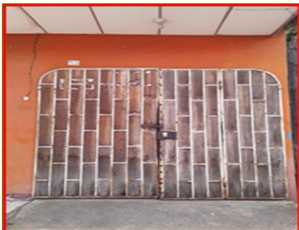
Instalaciones Fábrica Panorama Tobacco's