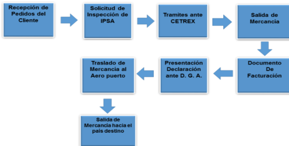
Figura No 1. Flujograma del proceso de exportación de la fábrica Panorama Tobacco's.