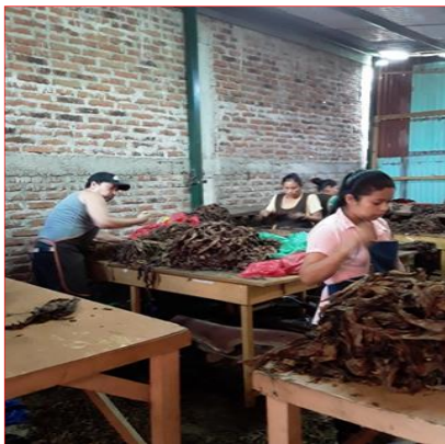
Colaboradores en labor de selección de Materia Prima