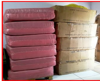
Paca de Materia Prima