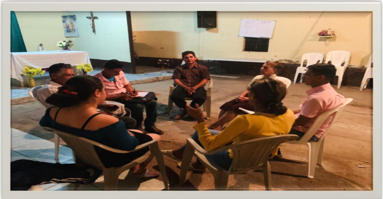
Aplicando grupo focal a líderes comunitarios