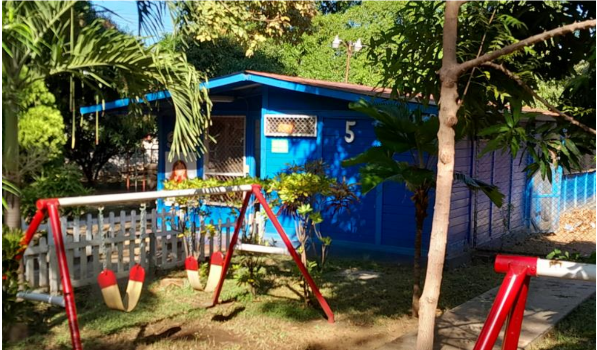
Aula niños I nivel