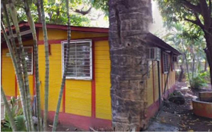
Dirección del Centro Arlen Siu