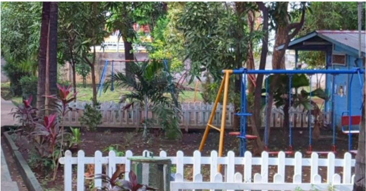
Área de juego niños I nivel