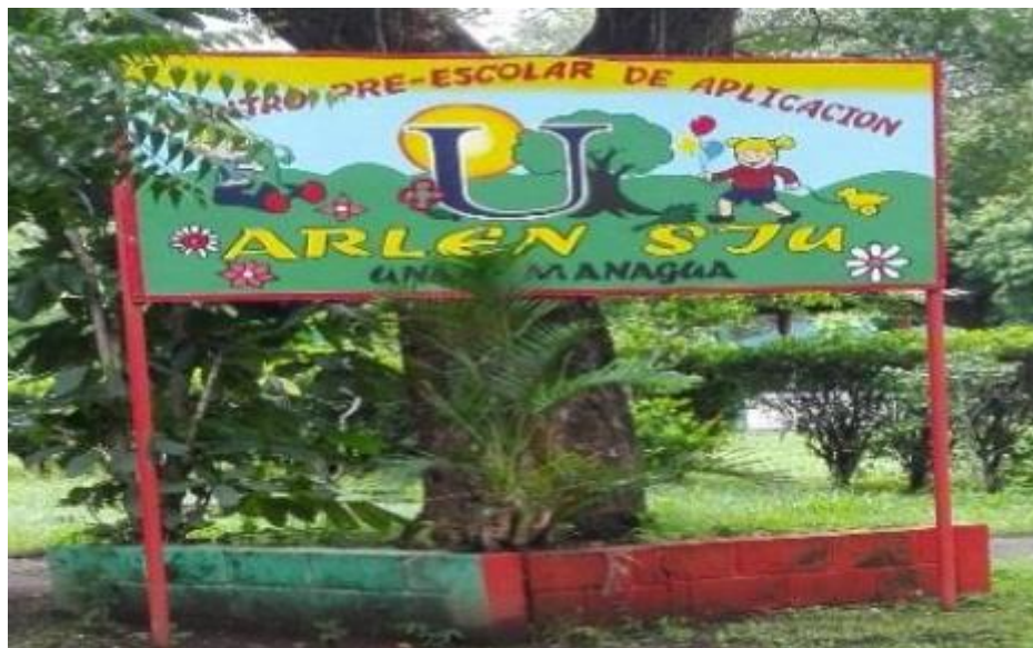
Rotulo dentro del centro