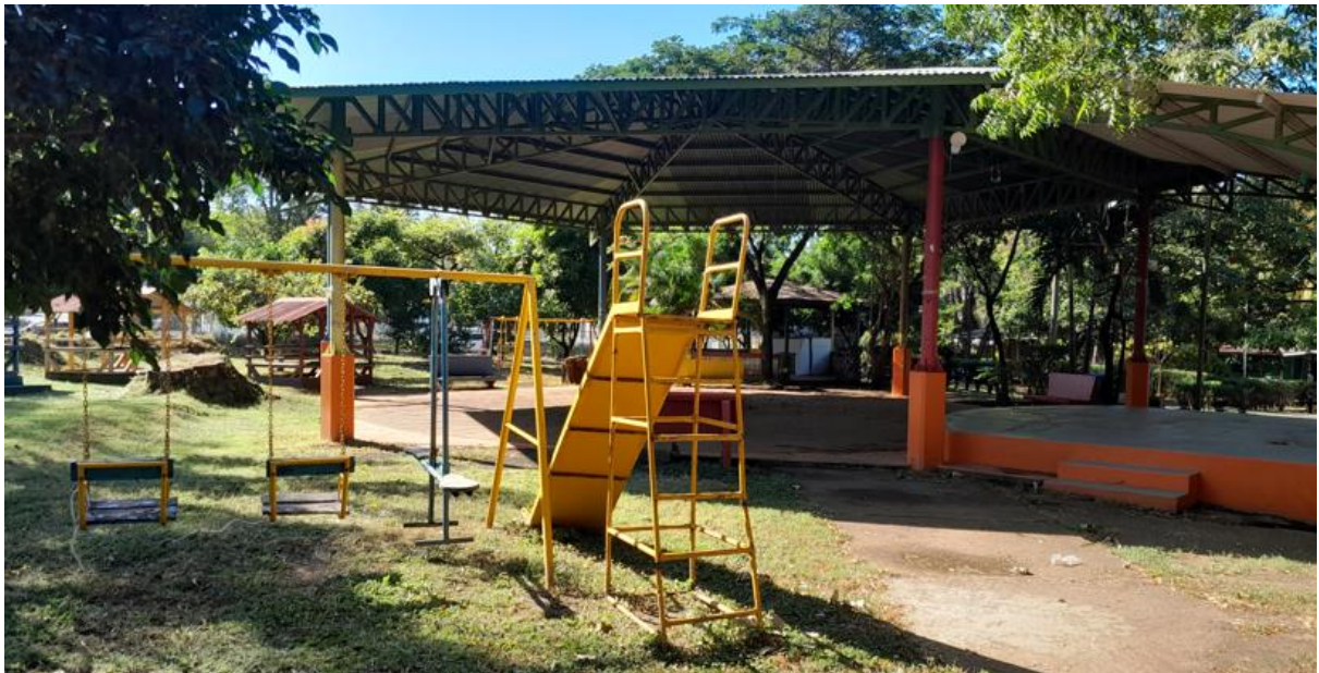
Área de juegos centro Arlen Siu