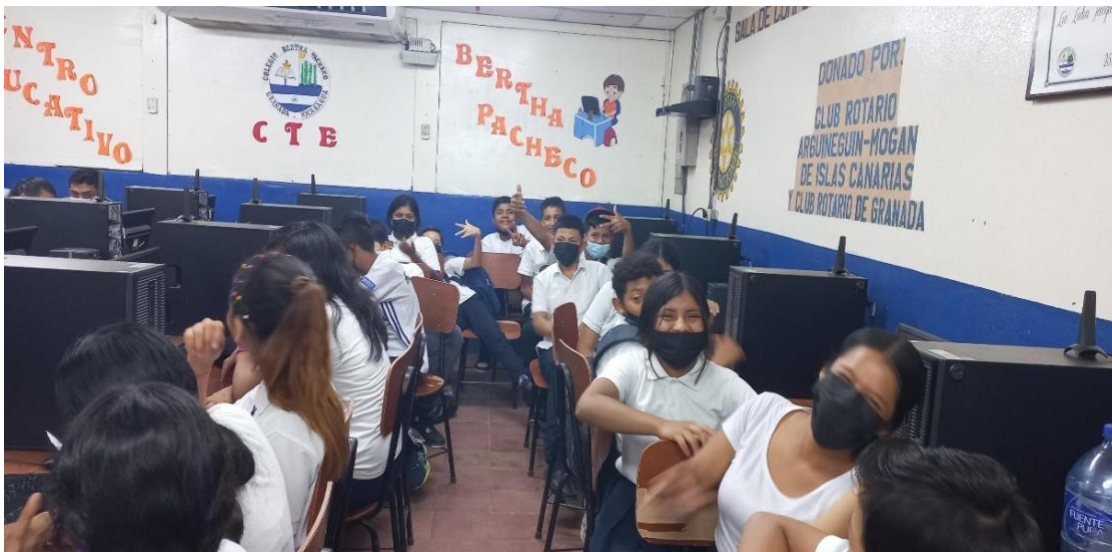
Estudiantes en el laboratorio de computación ensayando su canción.