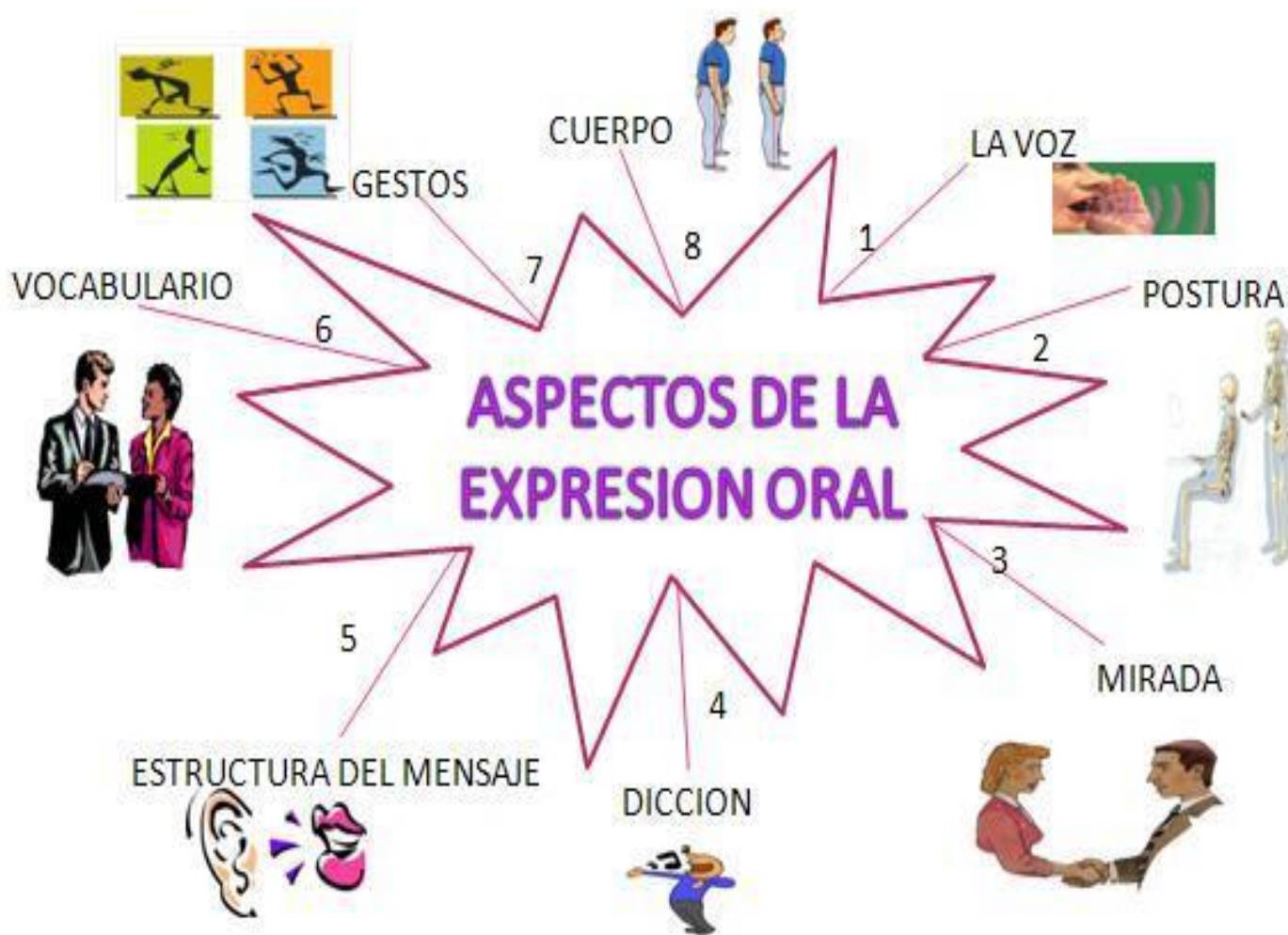
Ilustración 1 Elementos de la Expresión Oral

Las destrezas de comunicación, sin lugar a dudas, son un gran valor agregado que debemos desarrollar permanentemente.