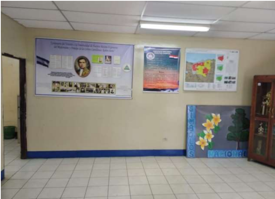
Nota: Sala de recepción del Instituto Maestro Gabriel.