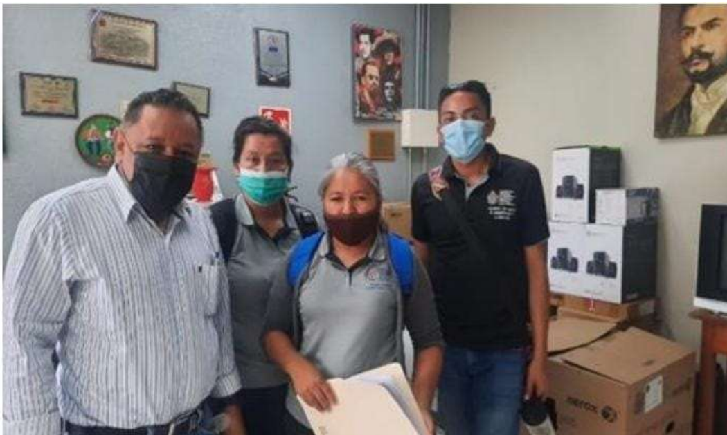
Nota: Oficina del Director del Instituto Maestro Gabriel, se le presentaron los instrumentos que se aplicarían al docente, estudiante.