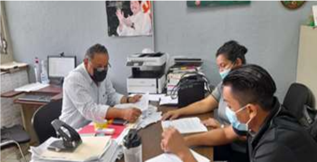
Nota: Entrevista al Director del Instituto Maestro Gabriel.