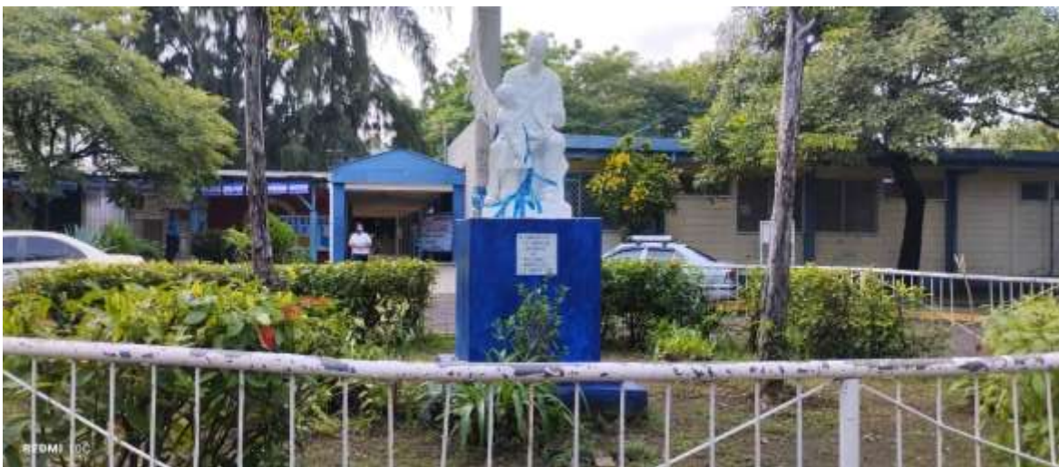
Nota: Instituto Nacional Maestro Gabriel, entrada principal