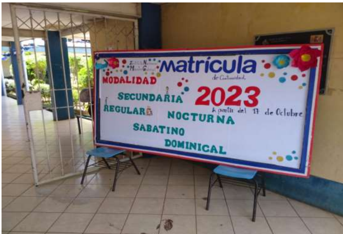
Nota: Segundo portón al Instituto Nacional Maestro Gabriel