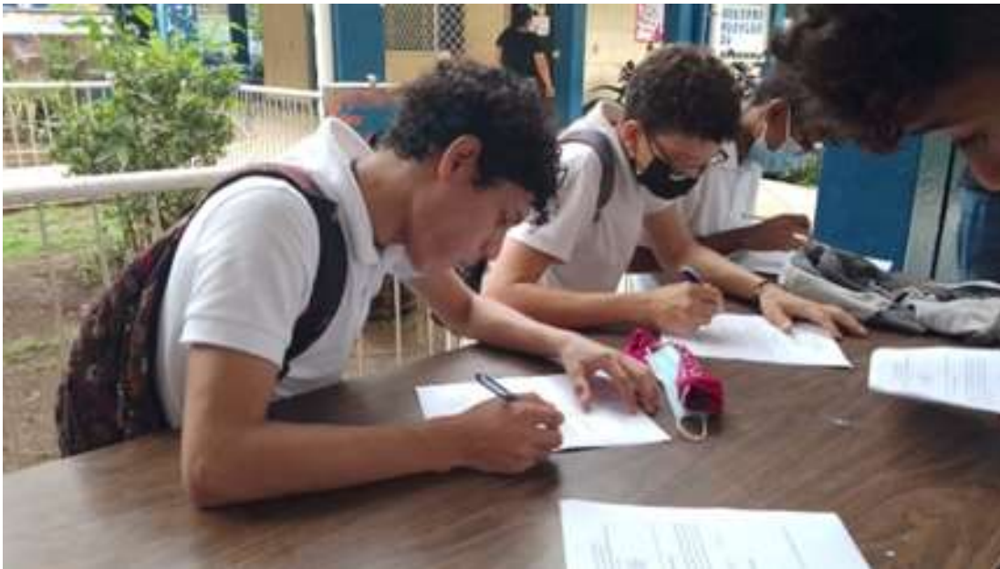
Nota: Entrevista a Estudiantes del Instituto Maestro Gabriel.