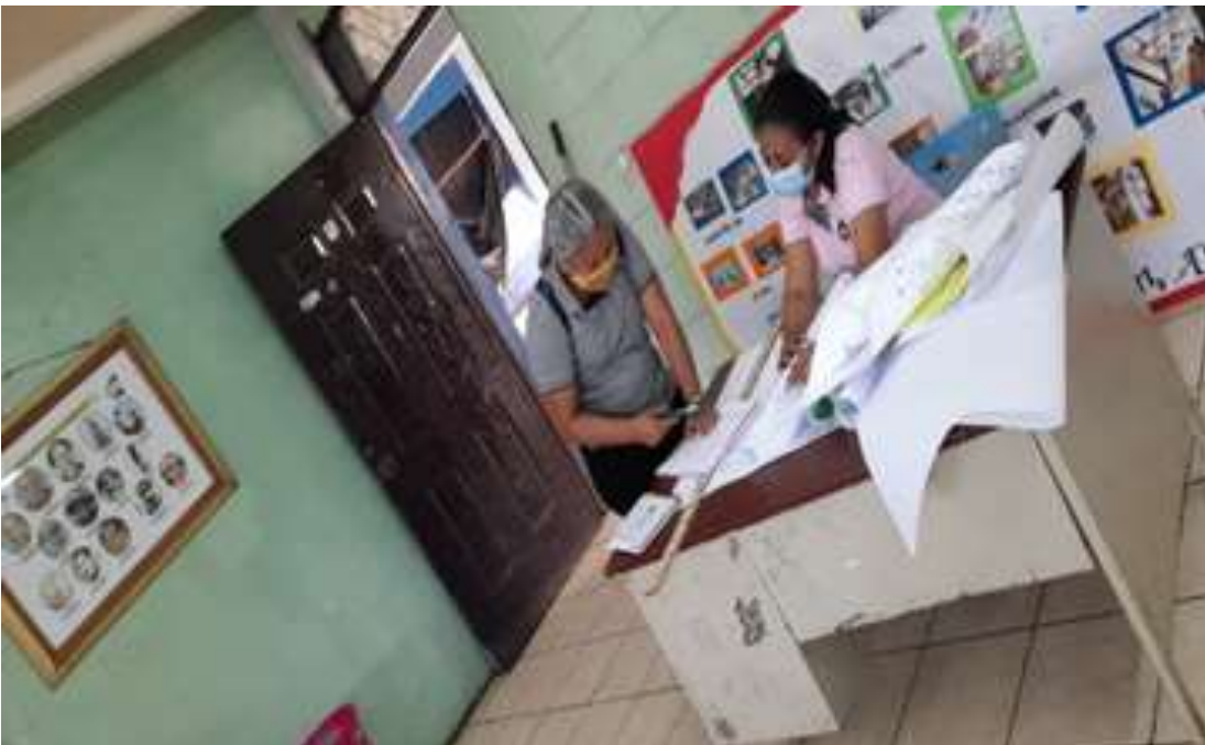
Nota: Ejecución de la Entrevista a Docente del Instituto Maestro Gabriel, en la sala de jefes de áreas.