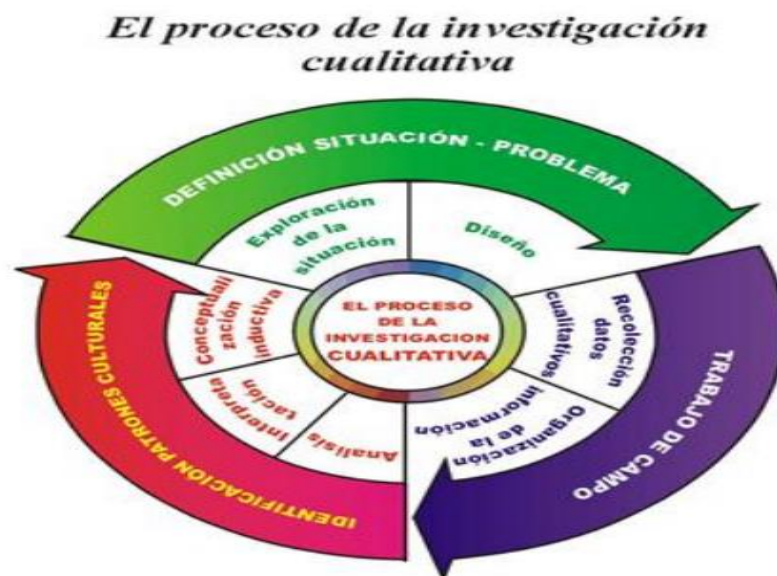
Figura 1, Proceso de la investigación cualitativa.

El método cualitativo acude a teorías interpretativas porque ellas comparten el objetivo de dar la palabra a las diferentes voces, personas o grupos sociales, con el fin de llevarlas a ocupar el lugar que les corresponde en el seno de la sociedad. Los investigadores disponen de un conjunto de paradigmas, métodos y estrategias para realizar la investigación. Las nociones de subjetividad, de perspectiva, de reflexividad y de textos desordenados adquieren importante valor, porque permiten ver claramente la realidad psicológica, emocional y espiritual de los actores implicados, Bautista (2011, pág. 15)