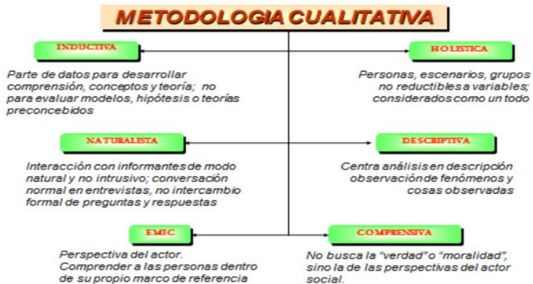
Figura 2, características del enfoque cualitativo de investigación.

certeza de que se tendrán sucesivamente oportunidades de precisar, redefinir y hasta orientar el estudio.