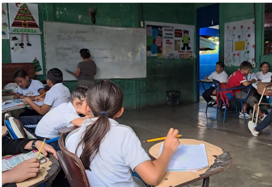
Figura 7. Aula de clase Colegio Público Esther Gallardy

Fuente: Observación en el aula de cuarto grado