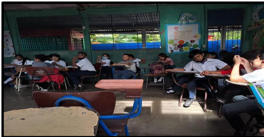
Figura 6. Contexto del Colegio Público Esther Gallardy.