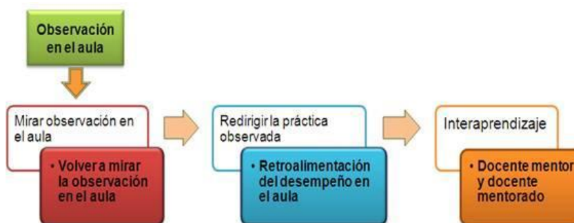
Figura 3. Acompañamiento Pedagógico

Fuente: (Brito. & Dra. María de Lourdes, 2014)