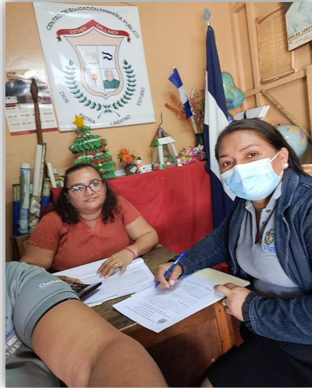
Figura 8. Entrevista a directora, Colegio Público Esther Gallardy