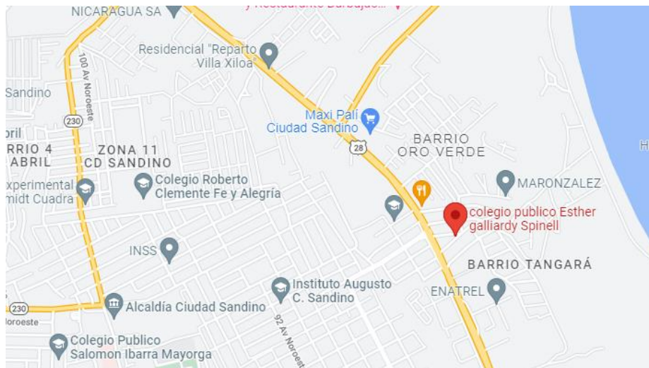
Figura 4. Cómo llegar al Colegio Público Esther Gallardy

El escenario es el lugar en el que el estudio se va a realizar, así como el acceso al mismo, las características de los participantes y los recursos disponibles que han sido determinados desde la elaboración del proyecto. (López, 1999)