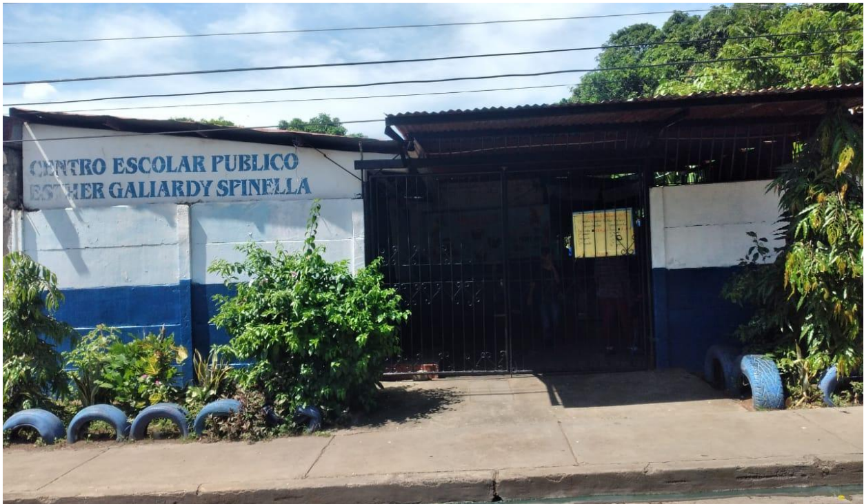
Figura 1. Colegio Público Esther Gallardy.