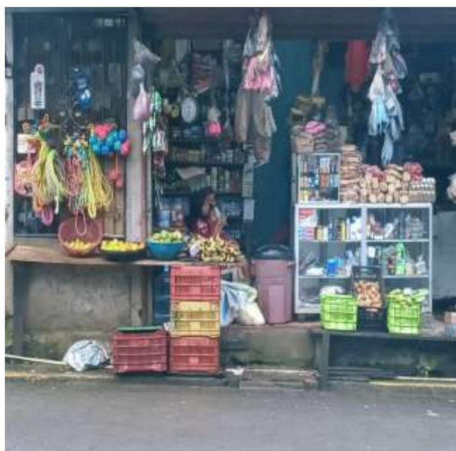
Imagen 12. Comercio del municipio de Siuna, fecha: 30 de septiembre del 2022, lugar: Siuna.