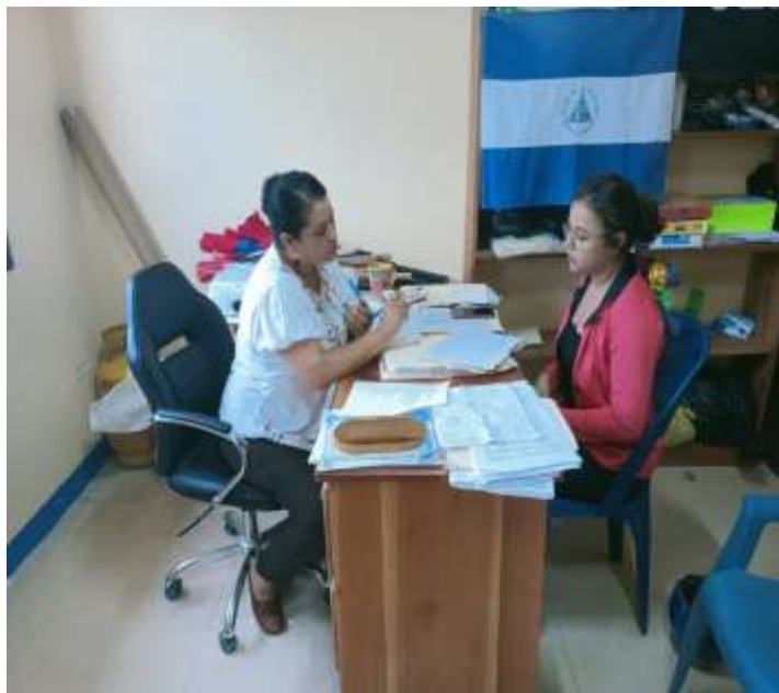
Imagen 05. Entrevista a secretaria política municipal (FSLN), fecha: 27 de septiembre del 2022, lugar: Casa Sandinista Siuna