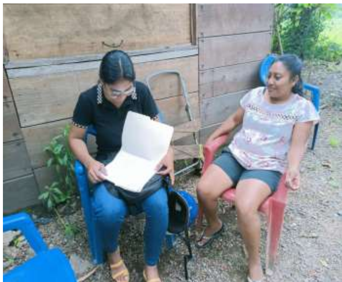
Imagen 07. Entrevista a mujer protagonista de Usura Cero, fecha: 27 de septiembre del 2022, lugar: casa de habitación de la entrevistada.