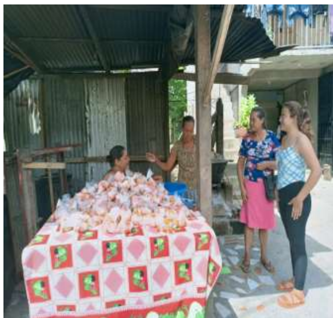
Imagen 11. Mujeres en el negocio de Pijibay de una de las protagonistas del programa, fecha: 27 de septiembre del 2022, lugar: puesto de venta Siuna.