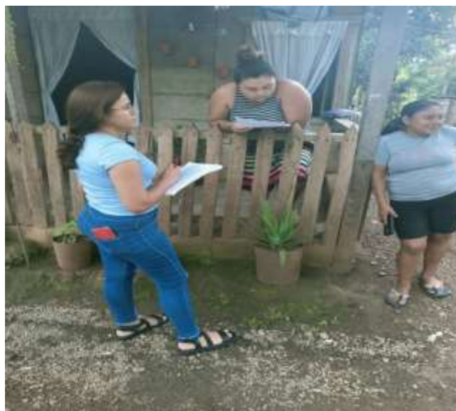
Imagen 08. Entrevista mujer protagonista de los programas, fecha: 27 de septiembre del 2022, lugar: casa de habitación de la entrevistada.