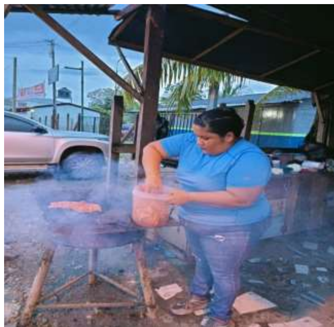
Imagen 10. Protagonista trabajando en su emprendimiento, fecha: 28 de septiembre del 2022 lugar: Asados Ere.