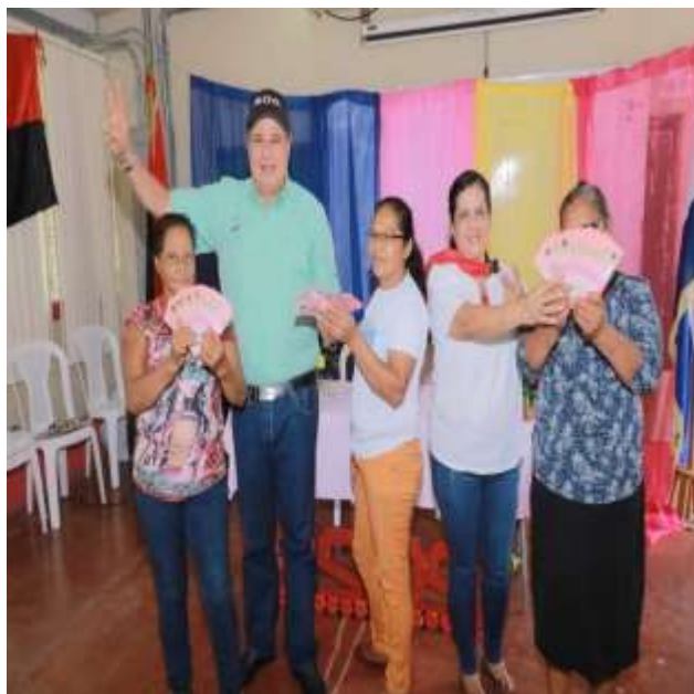
Imagen 06. Entrega del programa Usura Acero fecha: 16 de agosto del 2022, lugar: INATEC.