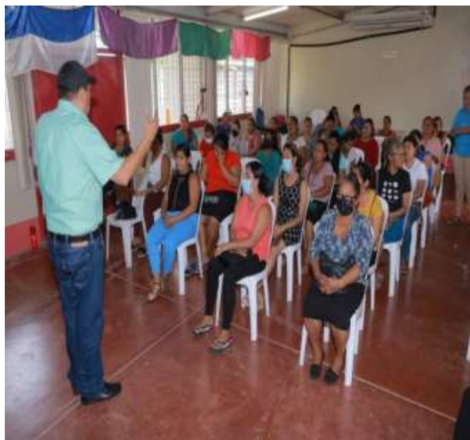
Imagen 09. Autoridades municipales en reunión con las protagonistas del programa Usura Cero, fecha: 16 de agosto del 2022, lugar: INATEC.