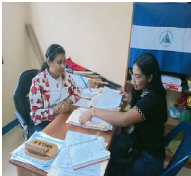
Imagen 04. Entrevista a delegada de Usura Cero Fecha: 27 de septiembre del 2022, lugar: Casa Sandinista Siuna