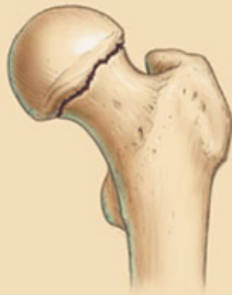
Fractura Subcapital del cuello femoral