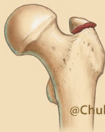
Fractura del Trocánter Mayor