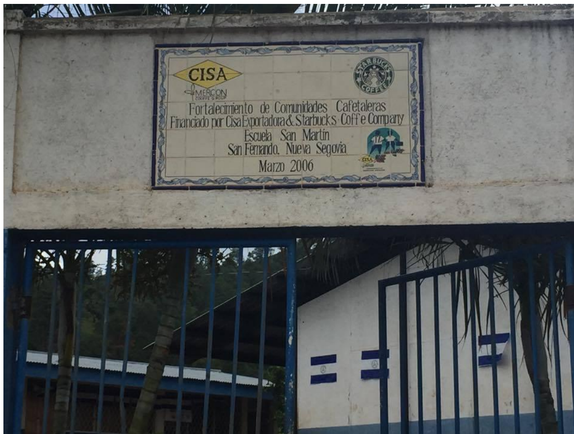
ESCUELA DE SAN FERNANDO POR APORTE DE CISA EXPORTADORA.