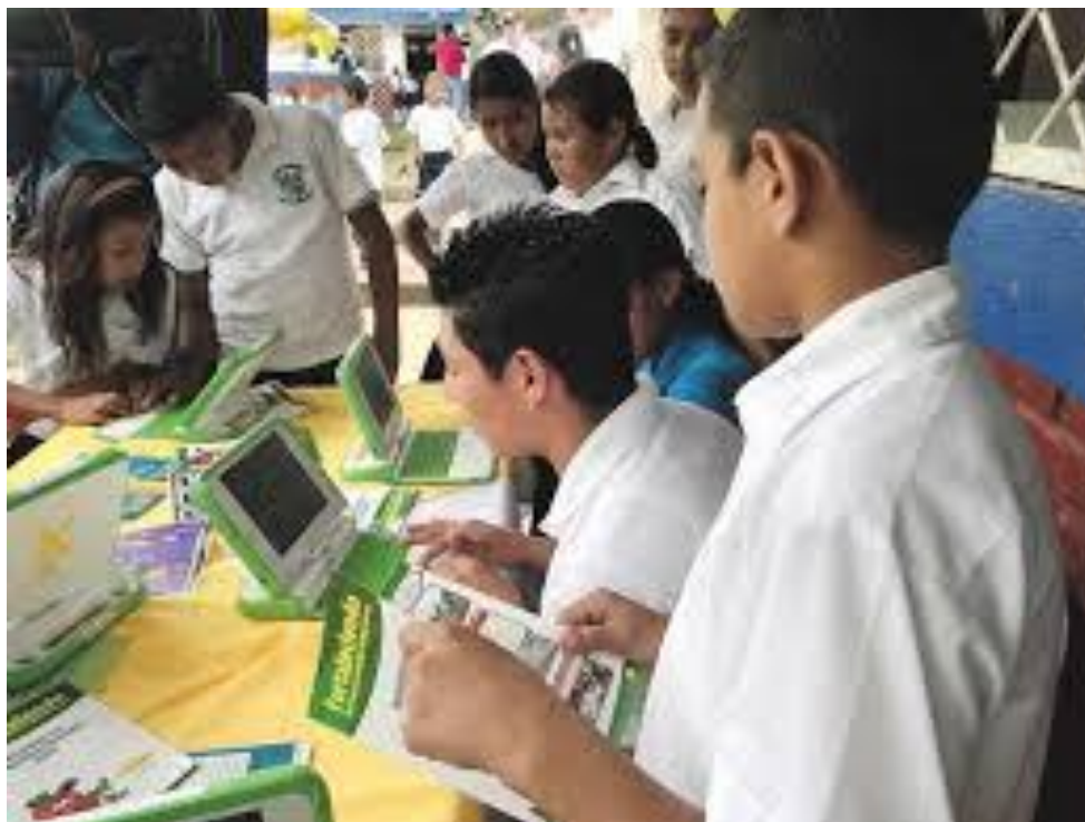
ESTUDIANTES BECADOS POR CISA EXPORTADORA