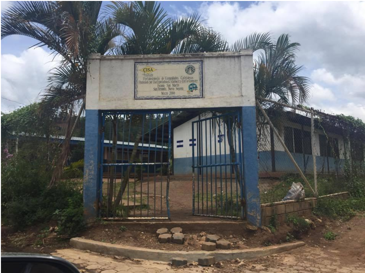
ESCUELA EN SAN FERNANDO POR APORTE DE CISA EXPORTADORA.