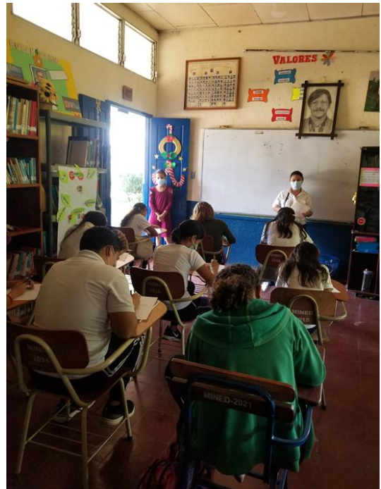
Ilustración 6. Aplicando entrevistas