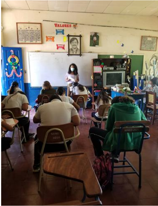
Ilustración 5. Aplicando entrevistas