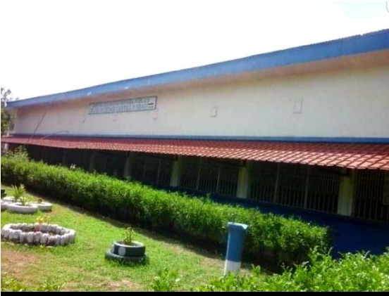
Ilustración 1 Colegio Julio César Castillo Ubau

Ubicación: El colegio Julio César Castillo Ubau, se encuentra en el municipio de Condega, barrió triunfo de la revolución, del mercado municipal 2 cuadras al este. En este centro educativo atiende educación inicial, preescolar, primaria de 1 grado 6 grado y secundaria de 7mo grado a 9no grado. En este local trabajan 1 director, 2 sub director, docentes, 823 estudiantes, secretaria, conserje, y guarda.