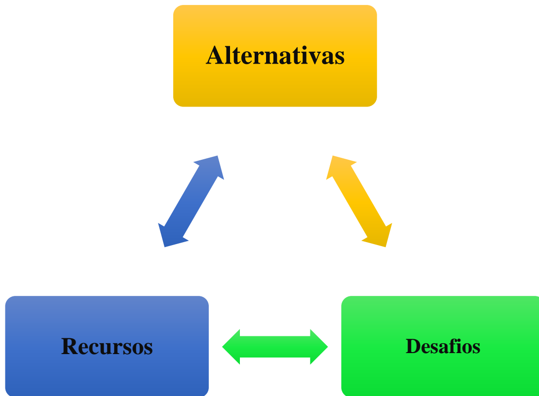
Ilustración 4. Gráfico de información