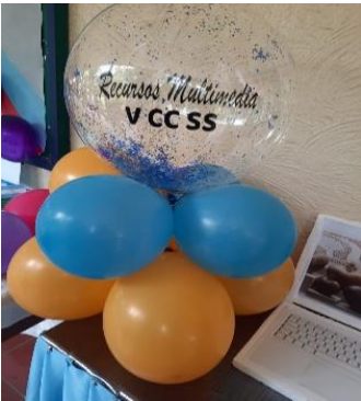
Figura 4. Utilizando recur