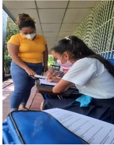
Figura 2 Aplicación de entrevista