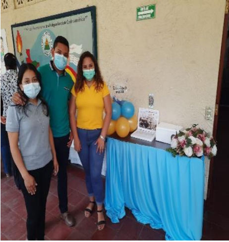
Figura 3. Autores del estudio